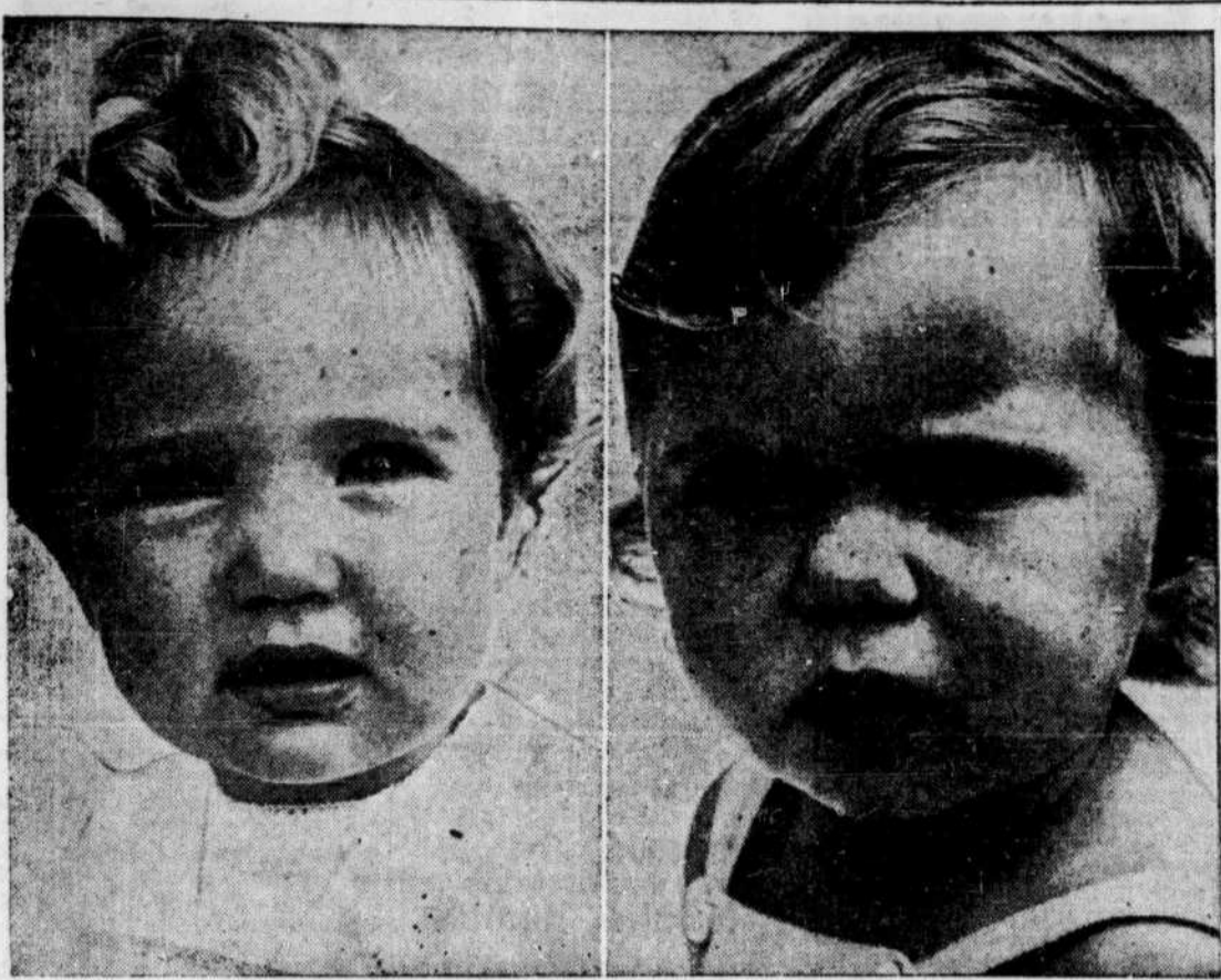
AIDONS SAINTE-JUSTINE! — De Montréal ou d'ailleurs, de tous les coins de la province, les enfants malades, blessés ou infirmes reçoivent à Sainte-Justine les meilleurs soins donnés par un personnel spécialisé de religieuses, de médecins et d'infirmières. A l'année longue des vies d'enfants sont sauvées, des infirmités corrigées ou évitées, des santé...