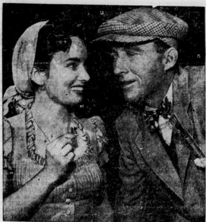
Bing Crosby et Ann Blyth, le couple charmant et inattendu du film "Top O' The Morning" qui présente cette semaine le cinéma Loew's.