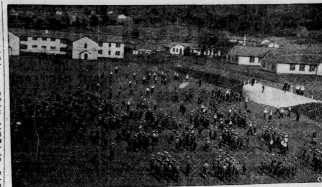
LA PLUS GRANDE ECOLE DE L'EMPIRE — Le centre d'instruction maritime de Cornwallis, en Nouvelle-Ecosse, vient d'être réouvert par la Marine canadienne, pour y entraîner ses recrues. Les gradus de cette école vont, comme on sait, servir ensuite à bord du croiseur "Ontario".

Intolérants, ils invoquent la tolérance. Ces derniers mots nous semblent bien révélateurs: ils font appel à l'esprit de tolérance des catholiques, esprit qui, soit dit en passant, n'est pas l'essence du christianisme.