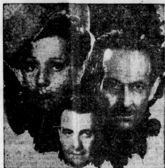
"LES CONDAMNÉS" AU PARIS — Yvonne Printemps, Pierre Fresnay et Roger Pigaut, les trois protagonistes du drame intense "Les Condamnés", qui prend aujourd'hui l'affiche au Cinéma de Paris.

SAINT-DENIS : "Le Gros Bill" : 12 h. 20, 2 h. 45, 5 h., 7 h. 10, 9 h. CINEMA DE PARIS : "Les Condamnés" : 11 h., 2 h. 20, 4 h. 45, 7 h. 25, 9 h. 50. CHAMPLAIN : "Les Deux Nigauds Cow Boy" : 12 h. 54, 3 h. 03, 5 h. 12, 7 h. 21, 9 h. 31. ELECTRA : "Aloma, Princesse Des Iles" : 1 h. 15, 3 h. 20, 5 h. 25, 7 h. 30, 9 h. 40. PALACE : "Sorrowful Jones" : 10 h. 20, 12 h. 40, 3 h. 5, 5 h. 20, 7 h. 35, 9 h. 55. LOEW'S : "Top O' The Morning" : 10 h. 15, 12 h. 35, 2 h. 55, 5 h. 10, 7 h. 30, 9 h. 45. CAPITOL : "It's A Great Feeling" : 10 h. 20, 12 h. 40, 3 h. 5, 5 h. 20, 7 h. 40, 10 h. PRINCESS : "Mighty Joe Young" : 10 h. 20, 12 h. 40, 2 h. 55, 5 h. 15, 7 h. 30, 9 h. 45. IMPERIAL : "The Henchmen" : 10 h. 12, 12 h. 40, 3 h. 20, 6 h., 8 h. 40. BUDD ABBOTT & LOU COSTELLO Meet The Killer" : 11 h., 10 h. 15, 12 h. 35, 2 h. 55, 5 h. 10, 7 h. 30, 9 h. 45. ORPHEUM : "Sh" : 10 h. 15, 12 h. 35, 2 h. 55, 5 h. 15, 7 h. 30, 9 h. 45. "Last Days Of Pompeii" : 11 h. 40, 3 h. 5, 6 h. 20, 9 h. 40.