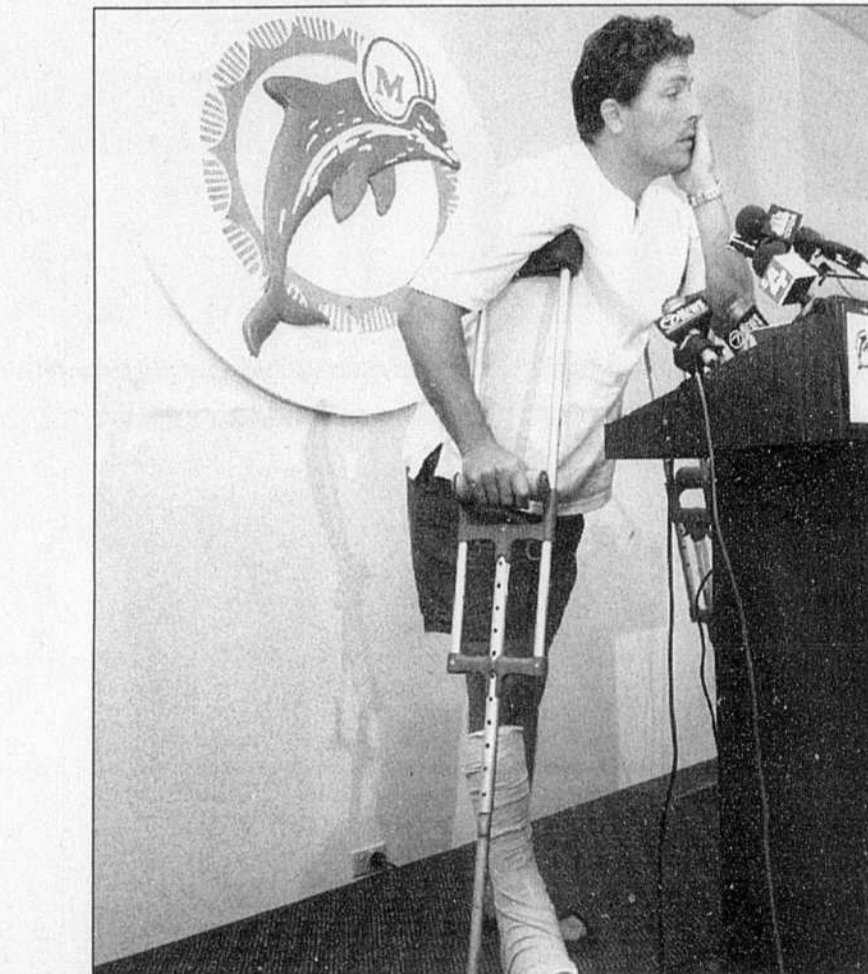
Dan Marino, des Dolphins de Miami, est l'un des nombreux quarts blessés.

De quelque manière qu'on examine la situation, ça tombe comme des mouches. Et à l'humble avis du non moins humble soussigné, l'hécatombe n'est pas terminée. Rick Mirer (Seattle) et Trent Dilfer (Tampa Bay)