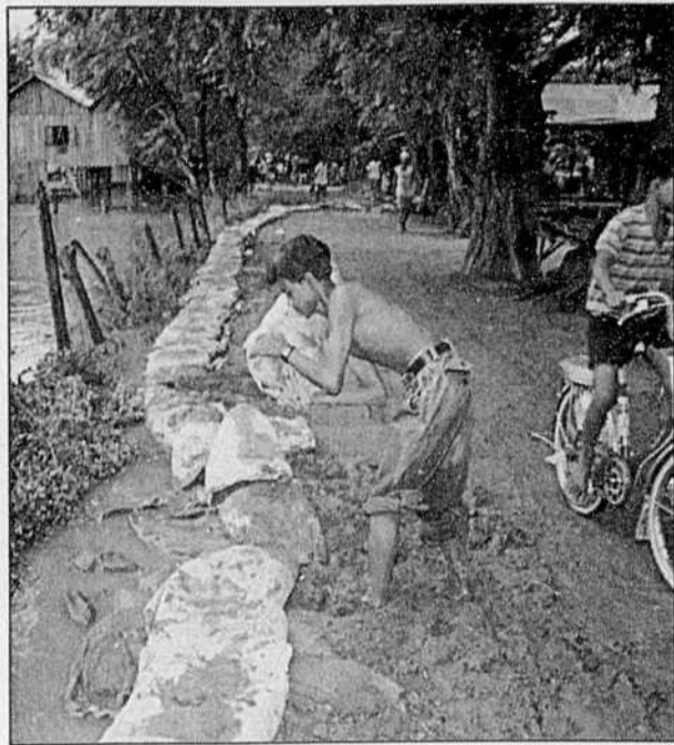
MENACE d'inondations à Phnom Penh, au Cambodge, où la crue des eaux risque de faire déborder le Mékong. En banlieue de la capitale, un résident construit une digue en empilant des sacs de sable.