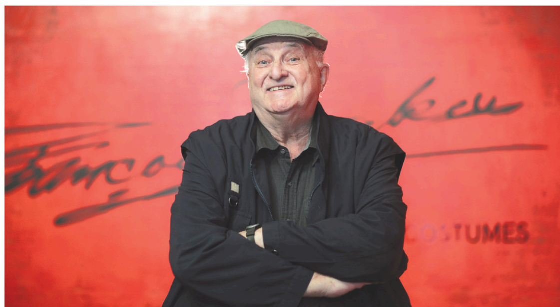
PEDRO RUIZ LE DEVOIR

Avis légaux..... B 4 Décès..... B 6 Météo..... B 7 Mots croisés..... B 7 Petites annonces..... B 6 Sudoku..... B 8