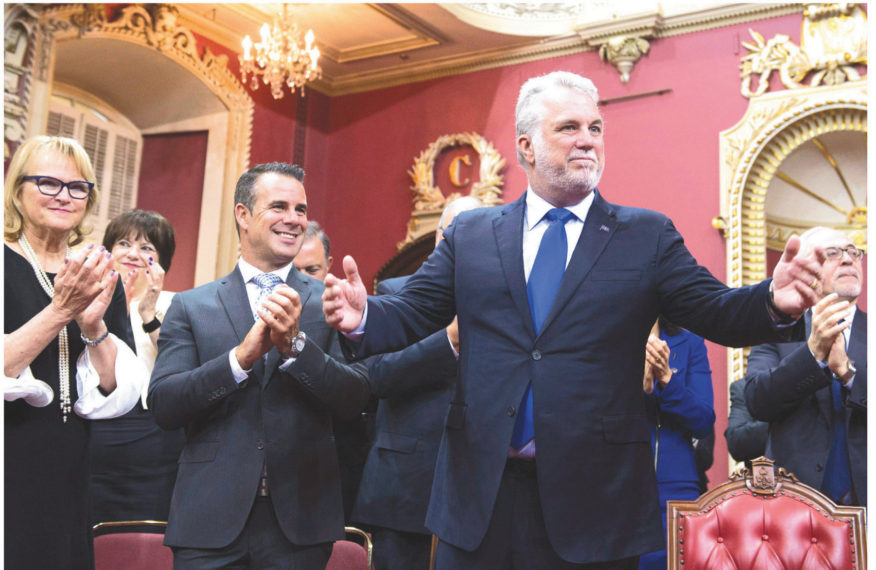
JACQUES BOISSINOT LA PRESSE CANADIENNE

Le PM remanie son cabinet en promettant des temps moins durs