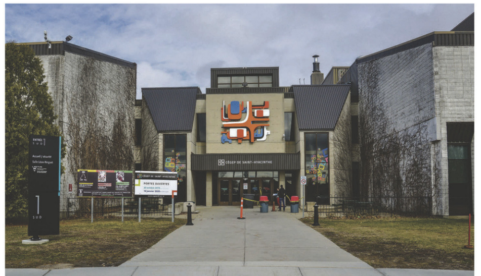
Le Cégep de Saint-Hyacinthe pourrait accueillir jusqu'à 1100 étudiants supplémentaires au sein de ses murs d'ici quatre ans.