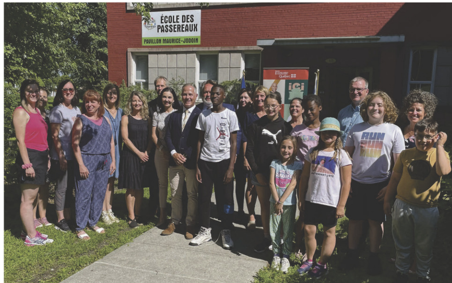
Les élèves de l'école des Passereaux auront un tout nouvel immeuble dans environ trois ans.

« Le personnel et les élèves auront accès à des milieux de vie modernes,