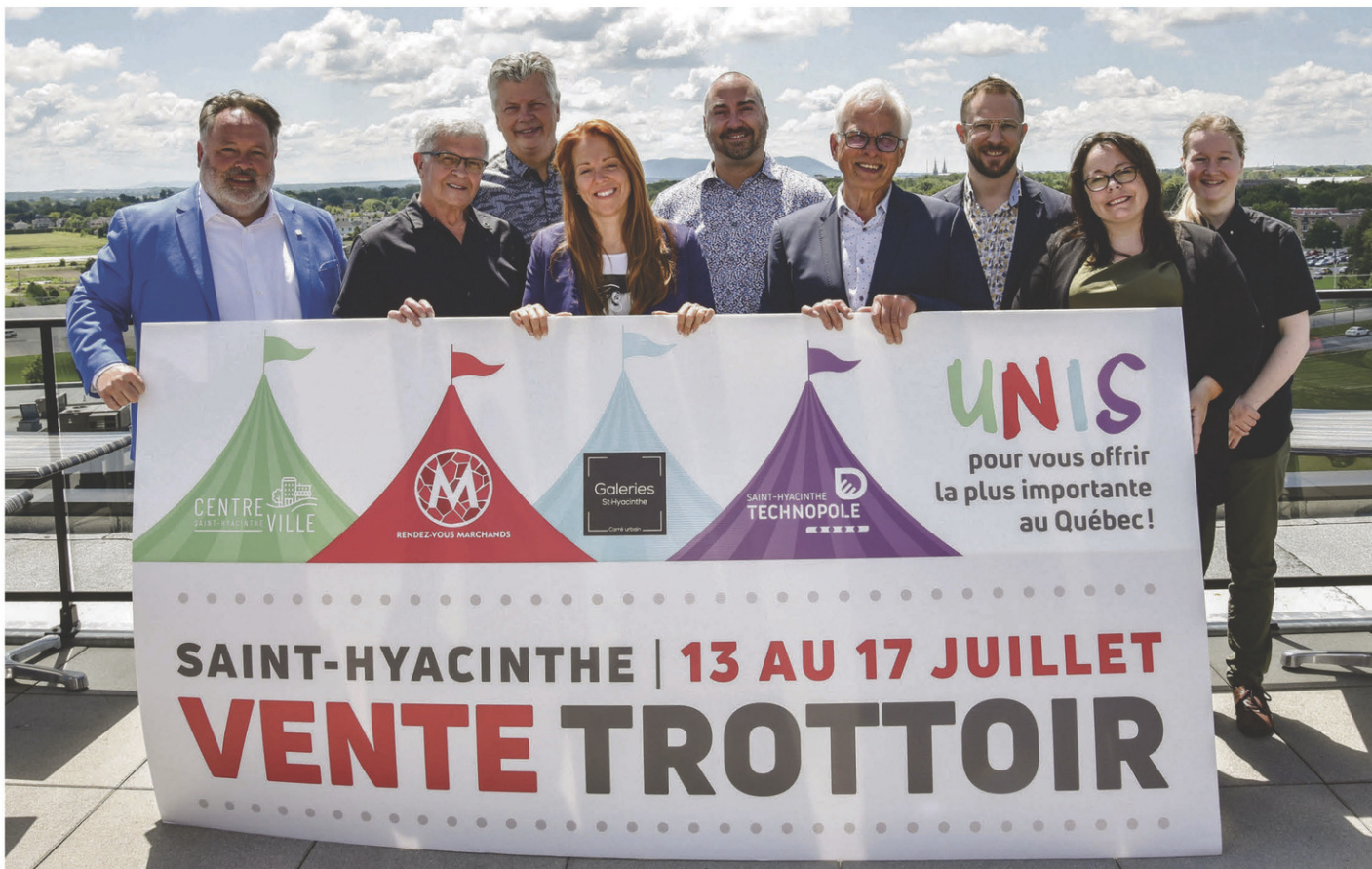
Les quatre pôles commerciaux de la ville de Saint-Hyacinthe se sont une fois de plus unis pour offrir une programmation variée et des aubaines en quantité pendant la vente trottoir.

La grande vente trottoir de Saint-Hyacinthe reviendra en force pour sa 10 e édition grâce au retour des activités et des animations pour toute la famille. Fidèle à ses habitudes, l'activité, qui se tiendra du 13 au 17 juillet, aura lieu dans les quatre pôles de la ville, soit le M Rendez-vous marchands, le centre-ville de Saint-Hyacinthe, les Galeries St-Hyacinthe et les autres commerces environnants.