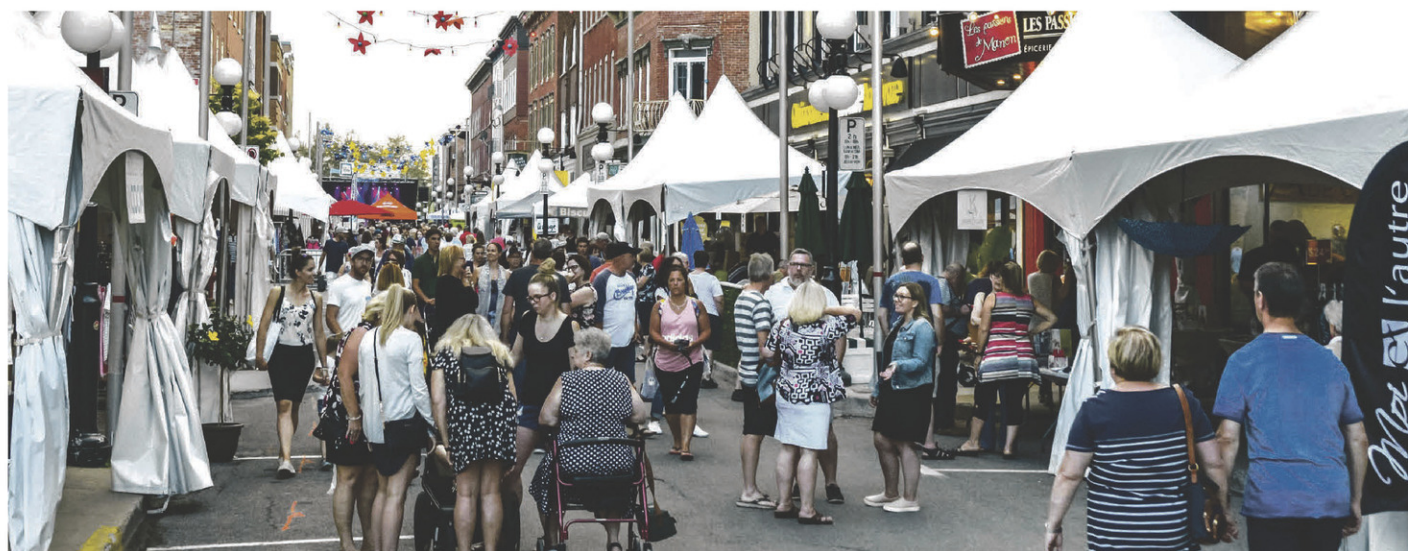
Les chasseurs d'aubaines sont attendus en grand nombre alors que la grande vente trottoir de Saint-Hyacinthe retrouvera des allures de normalité avec une programmation étoffée.