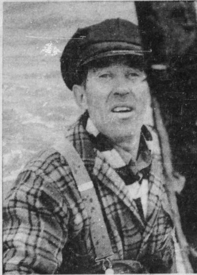
Une scène du long métrage canadien de Michel Brault et Michel Perreault Pour la suite du monde . Ce film sera présenté aux téléspectateurs du réseau français de télévision de Radio-Canada, le dimanche 4 août, à 8 heures du soir, le même soir de sa présentation au Festival international du film.

De 5 à 6 : l'heure des enfants Rappelons que, en plus des Croquignoles, les enfants peuvent voir leurs émissions, tout au cours des vacances, du lundi au vendredi, de 5 à 6 heures. A 5 heures, d'abord: le lundi, Le Pigeon ; le mardi, Grand Prix ; le mercredi, L'Épée de Florence ; le jeudi, Roquet, belles oreilles , et, le vendredi, évidemment, les Croquignoles. A 5 h. 30, du lundi au vendredi, c'est la P'tite Semaine .