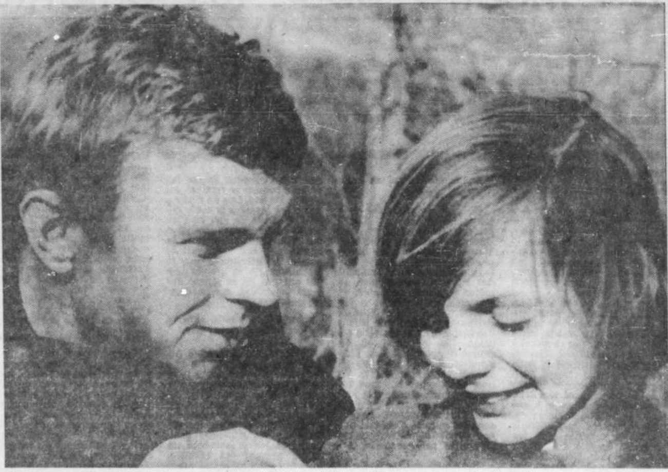
"LES DIMANCHES DE VILLE D'AVRAY", le premier film de Serge Bourguignon, raconte les amours chastes d'un grand blessé de guerre et d'une petite fille... C'est une réussite de la sensibilité — AU PARISIEN.