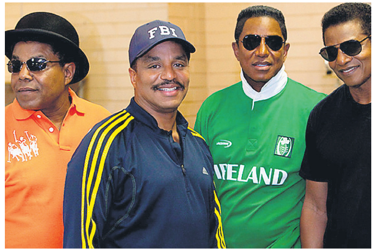
Les membres restants des Jackson Five.