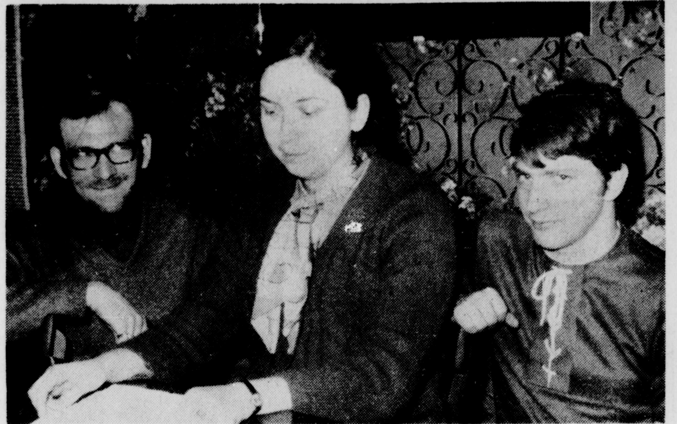
A Victoriaville, des chômeurs ont du cœur au ventre et veulent travailler. Dans cette optique, ils ont mis sur pied différents services pour la population. Les principaux