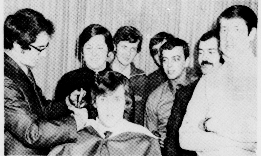
Le Salon Robert de Nicolet était le théâtre, depuis janvier, d'une série de cours de recyclage donnés aux barbiers de la région. Une douzaine d'entre eux ont suivi le cours de nouvelles coupes de

On notait de plus la présence de 147 régentes de cercles québécois. Au banquet du congrès, on a compté plus de 1,000 convives. La robe longue était de mise à ce banquet qui fut de toute beauté et s'avéra un succès complet.