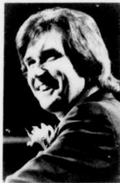
Animateur: Serge Laprade, avec la collaboration de Jacques Houde. Scripteur et chercheur: Michel Dugradne. Réal.: Lisette LeRoy.