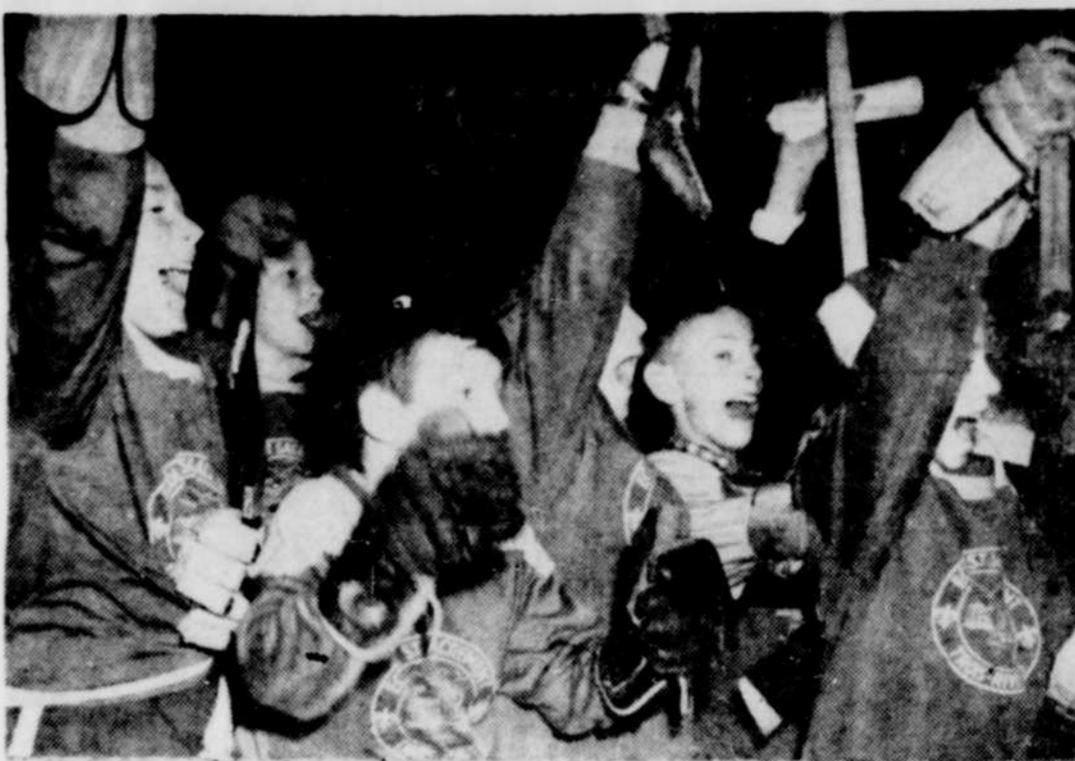
On a gagné Victoire! Victoire!...

Des surprises Le festival a été fécond en surprises. Les écoliers se souviendront longtemps des numéros présentés par les écoles, en particulier celui de Saint-Paul. Il s'agissait pour les candidats de retracer sur la vaste patinoire un porcelet en liberté. La difficulté était grande; le petit cochon était fa-