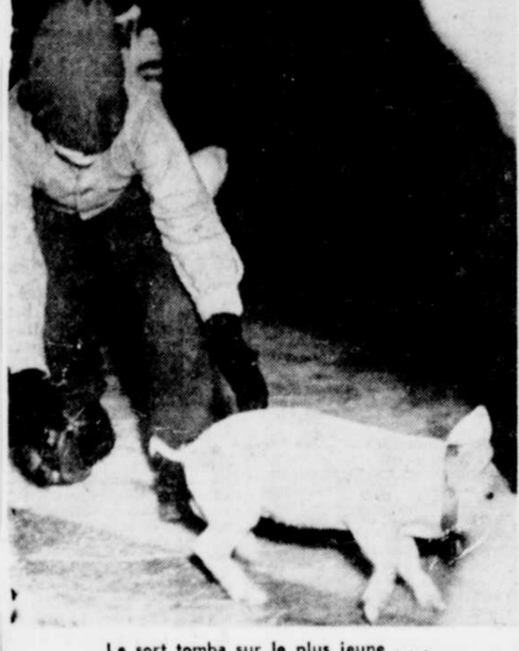
Le sort tomba sur le plus jeune...

Au Texas, la pire bourrasque depuis 50 ans