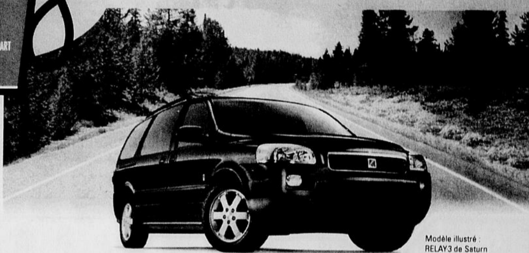
Modèle illustré : RELAY3 de Saturn