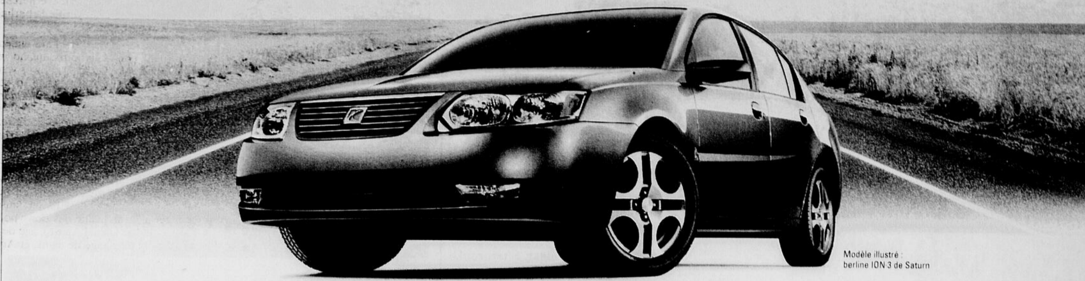
Modèle illustré : berline ION 3 de Saturn