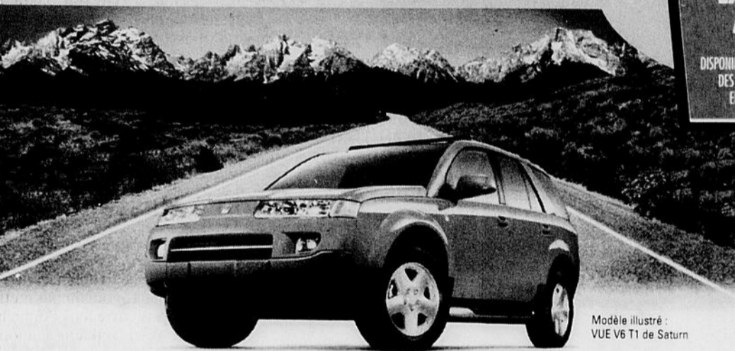
Modèle illustré : VUE V6 T1 de Saturn