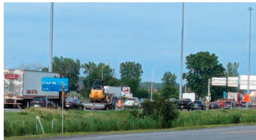
Les travaux de la troisième voie sur l'autoroute 20 à la hauteur de Sainte-Julie ont un impact sur la circulation dans la ville.

« Donc peut-être que l'année prochaine, on devrait avoir accès à une bonne partie de cette troisième voie qui n'est pas encore accessible. Le trafic dense, il sera après la sortie 105 et non plus la sortie 102, qui est la sortie de Sainte-Julie », a-t-il souhaité.