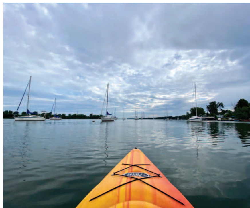
Une sortie sur l'eau à Boucherville.

Le Québec compte 64 parcours certifiés. Et ce n'est pas terminé car l'objectif est d'en ajouter 15 de plus en Montérégie l'été