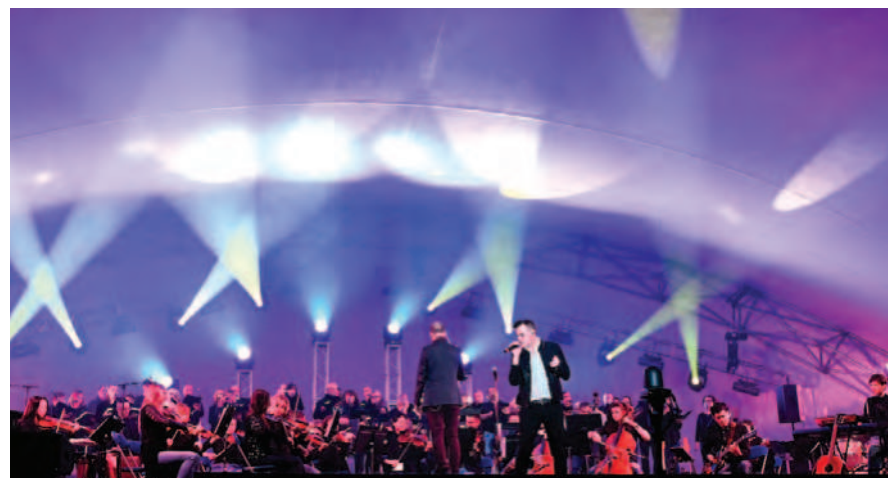
Le Rendez-vous de la Mairie est le plus grand rassemblement estival des Bouchervillois

Sur la grande scène extérieure du parc de la Rivières-aux-Pins, les plus grands succès