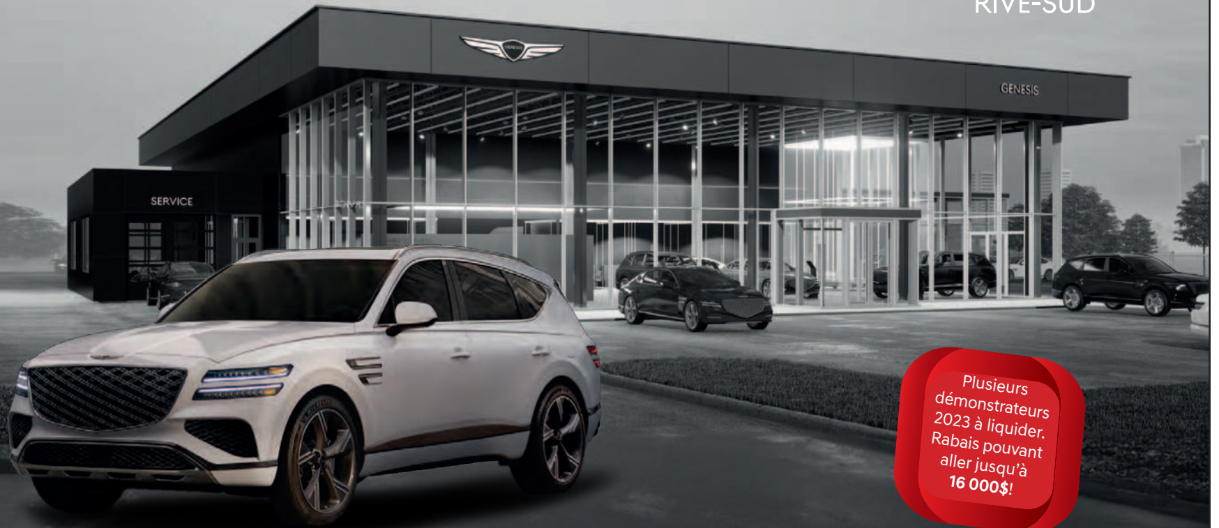
GENESIS GV80 2025

Plusieurs démonstrateurs 2023 à liquider. Rabais pouvant aller jusqu'à 16 000$!