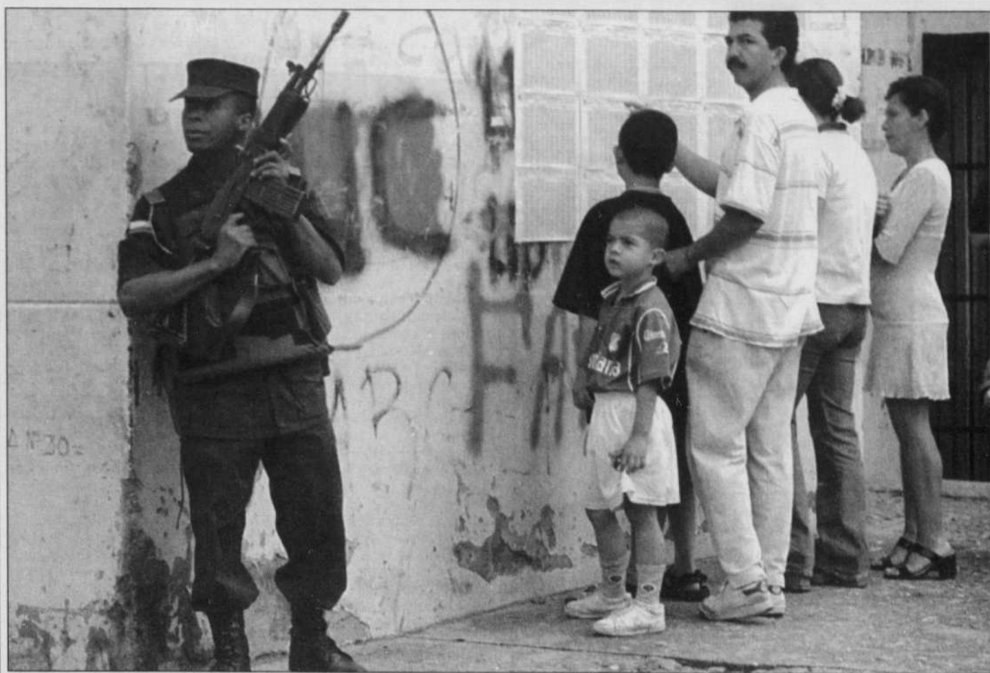
Les Colombiens ont voté hier sous la protection de 212 000 militaires et policiers.

L'Inde et le Pakistan se sont déjà livrés deux guerres à propos du Cachemire depuis l'indépendance en 1947.