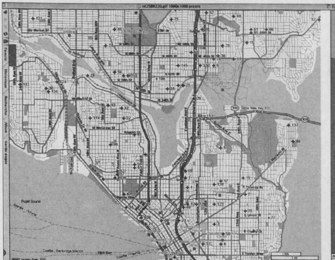
Certaines zones de Seattle sont maintenant accessibles à toute personne ayant un portable ou un assistant numérique personnel équipé d'une carte 802.11b.

Mais qu'arriverait-il si j'installais une antenne plus puissante sur le toit de ma maison, que je reliais celle-ci à ma borne d'accès, et que je limitais l'accès à ma borne en ne permettant uniquement qu'une voie d'entrée à Internet? Je viendrais ainsi de mettre à la dis-