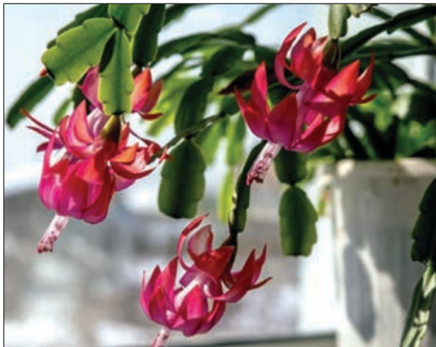
Cactus de Noël

Aussi, contrairement au véritable cactus de Noël, elles viennent dans une bonne gamme de couleurs : rouge, fuchsia, magenta, lavande, rose, blanc, jaune et même orange. On trouve facilement le cactus d'automne dans tous les magasins durant le temps des Fêtes, même dans les supermarchés.