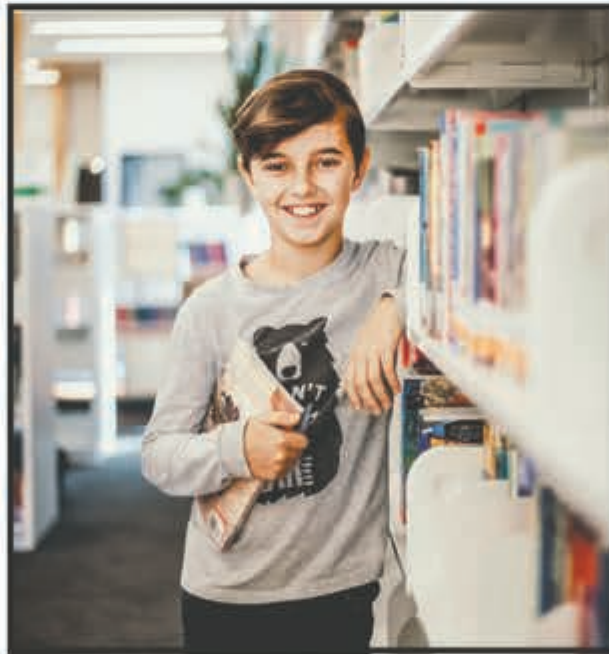
Les bibliothèques sont beaucoup qu'un lieu de lecture.