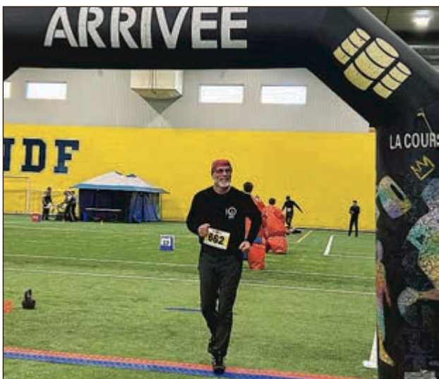
Il a complété avec succès l'épreuve de 5 km avec obstacles.