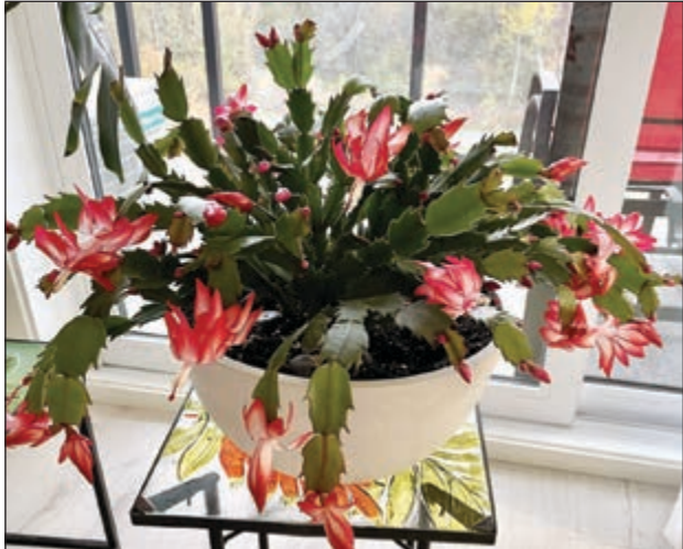
Cactus d'automne

Votre cactus de Noël est déjà en fleurs bien avant Noël ? C'est normal.