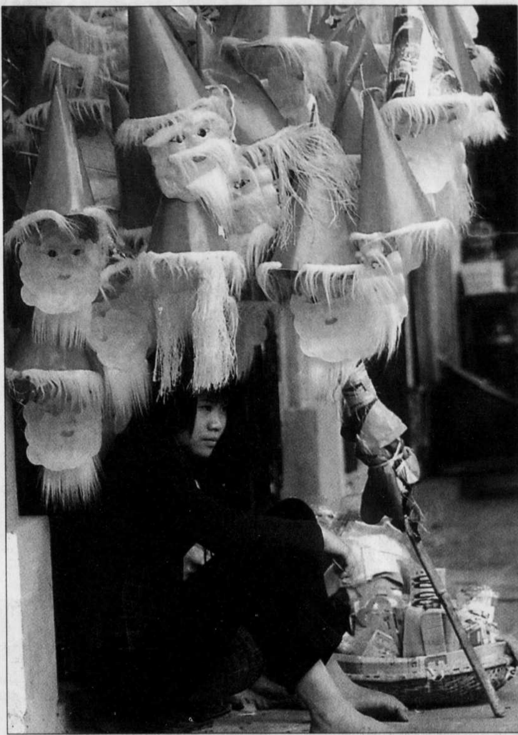
Le règne d'Ông Già Noël (père Noël en vietnamien) est certainement là pour rester.

Dans ce coin de l'Asie où la neige n'est présente que sur les photos montagnardes accrochées aux murs des hôtels décrépis et où le catholicisme est plus que minoritaire, la scène, un brin surréaliste, est aussi incongrue que celle, improbable, de milliers de bouddhas s'emparant des rues commerciales, des bureaux et des maisons de Montréal à l'approche de la fête du Têt, le nouvel an lunaire célébré en grande pompe par les Asiatiques au début du mois de février. Et pourtant, depuis le début de la semaine, cette scène ne cesse de se reproduire un peu partout dans la ville, dans les lieux touristiques,