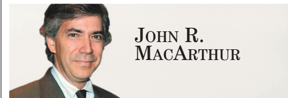
JOHN R. MACARTHUR

Tiens. Un grand nombre d'électeurs européens, dépourvus de leur souveraineté et de leur emploi, sont mécontents. Soit en France, où le Front national a reçu 25% des suffrages, soit en Grèce, où Syriza a marqué un score de 26,6%, soit en Espagne, où 18% ont voté pour les deux formations de gauche les plus radicales et anti-libérales, les élections européennes signifient une révolte importante contre une bureaucratie à Bruxelles perçue comme arrogante et éloignée de la crise quotidienne.