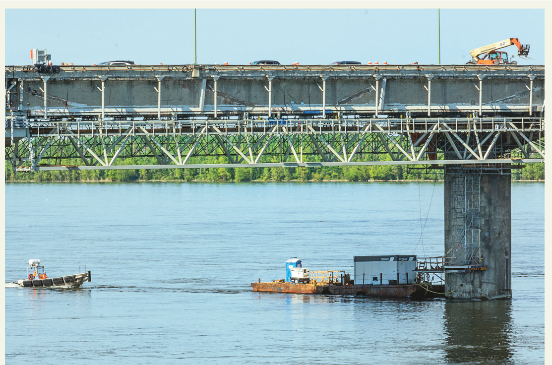
MICHAËL MONNIER LE DEVOIR