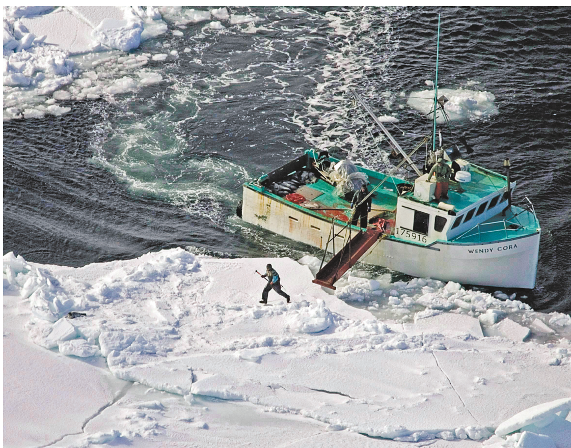
La chasse aux phoques se concentre dans certaines régions économiquement plus vulnérables du Québec, notamment aux îles de la Madeleine, où le chômage est particulièrement élevé.

L'OMC conclut que les exceptions du régime européen discriminent les produits canadiens et sont contraires aux principes libre-