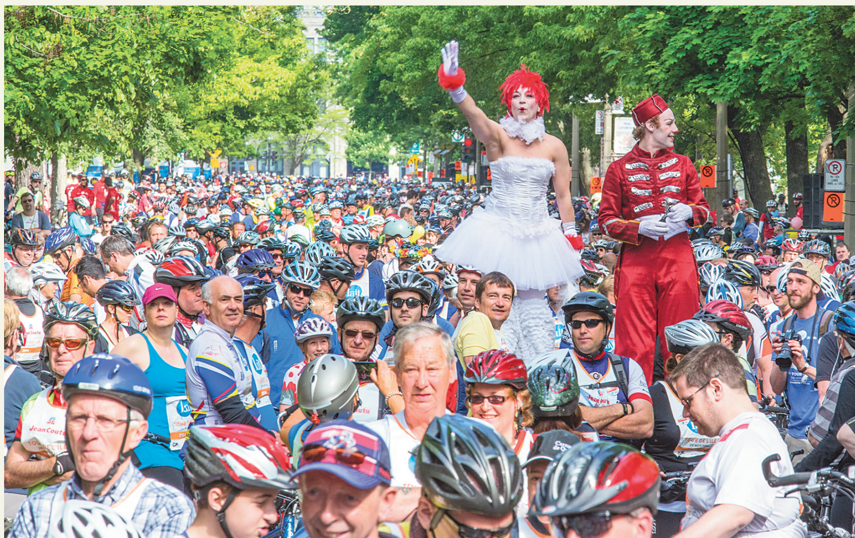
MICHAËL MONNIER LE DEVOIR

25 000 CYCLISTES POUR LE 30 E TOUR DE L'ÎLE