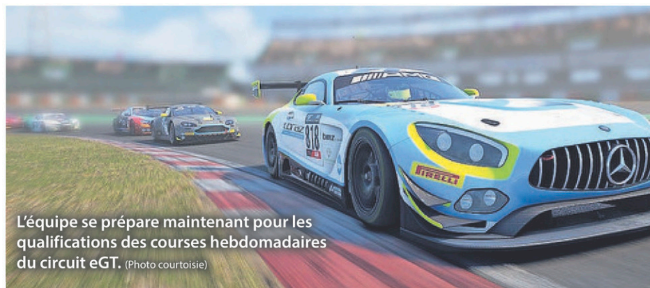
L'équipe se prépare maintenant pour les qualifications des courses hebdomadaires du circuit eGT.

« Tout le monde de l'équipe est touché de près ou de loin par le cancer. Notre mère a été