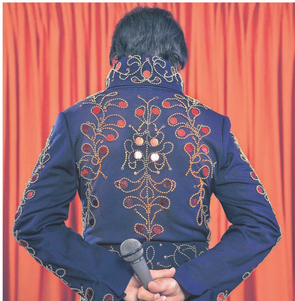
Le film «King Lajoie» sera diffusé sur la page Facebook du Festival Plein(s) Écran(s) le 20 janvier au https://www.facebook.com/pleinsecrans/ .

Le film produit en collaboration avec la CBC a déjà figuré à la programmation de plusieurs festivals à travers le monde. Le 20 janvier, «King Lajoie» sera diffusé gratuitement sur la page Facebook de Plein(s) Écran(s).