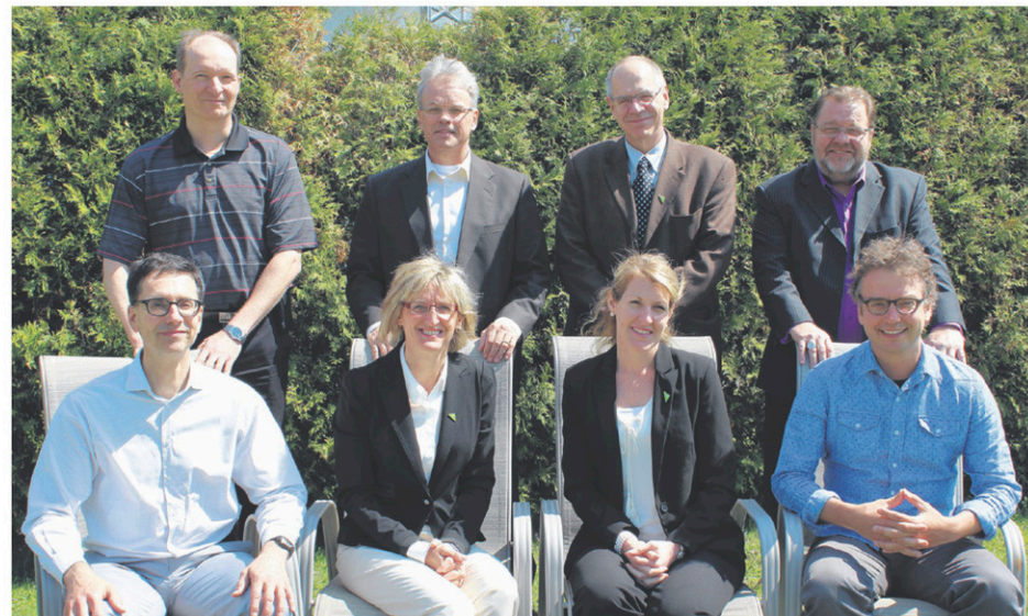
Les représentants des SADC+CAE de la Mauricie et du Centre-du-Québec.

Soutien aux petites entreprises des SADC et CAE de la région