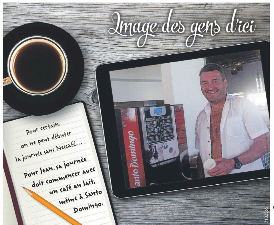
Image des gens d'ici

La saison 2017 satisfait les établissements d'hébergement du secteur de Parent. «C'est très bon cette année. Il n'y avait pas de neige en ville (...) On a reçu bien des gens qui ne venaient pas