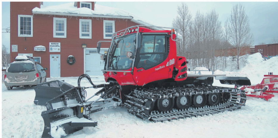
On voit la nouvelle surfaceuse acquise au cours des dernières semaines de par le Club de motoneige Alliance du nord de Parent.

Le 17 janvier, une surfaceuse prend feu dans un des sentiers. Persévérants et tenaces, les