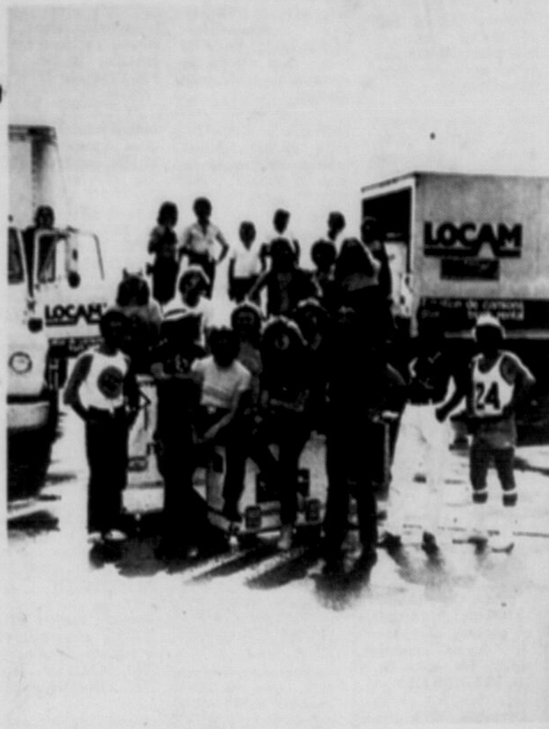
Offenbach, Garolou et Zachary Richard, seront en spectacle à Valleyfield, mardi le 1er septembre.

Parmi les événements artistiques importants de l'été 1981, il en est un qui ne détache déjà comme une véritable vedette de tout le Québec: la TOURNEE QUEBEC ROCK. Baptisée d'après un des premiers "hits" du groupe OFFENBACH, la TOURNEE QUEBEC ROCK défilera sur les arènes et collées du Québec, d'est en ouest, débordant même jusqu'à Moncton et Ottawa, entre le 12 août et le 8 septembre prochains. Valleyfield en sera l'hôte, mardi le 1er septembre à compter de 20h.