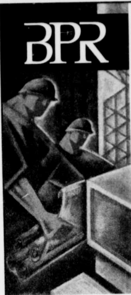
Nous offrons des chances d'emploi égales à tous.

BPR Ingénieurs-Consueils, membre du groupe BPR, importante société d'ingénierie regroupant une équipe multidisciplinaire répartie dans neuf bureaux au Québec, fournit aux entreprises ainsi qu'aux organismes publics et privés, des services d'ingénierie, de gestion de projet, de construction et d'exploitation des ouvrages.