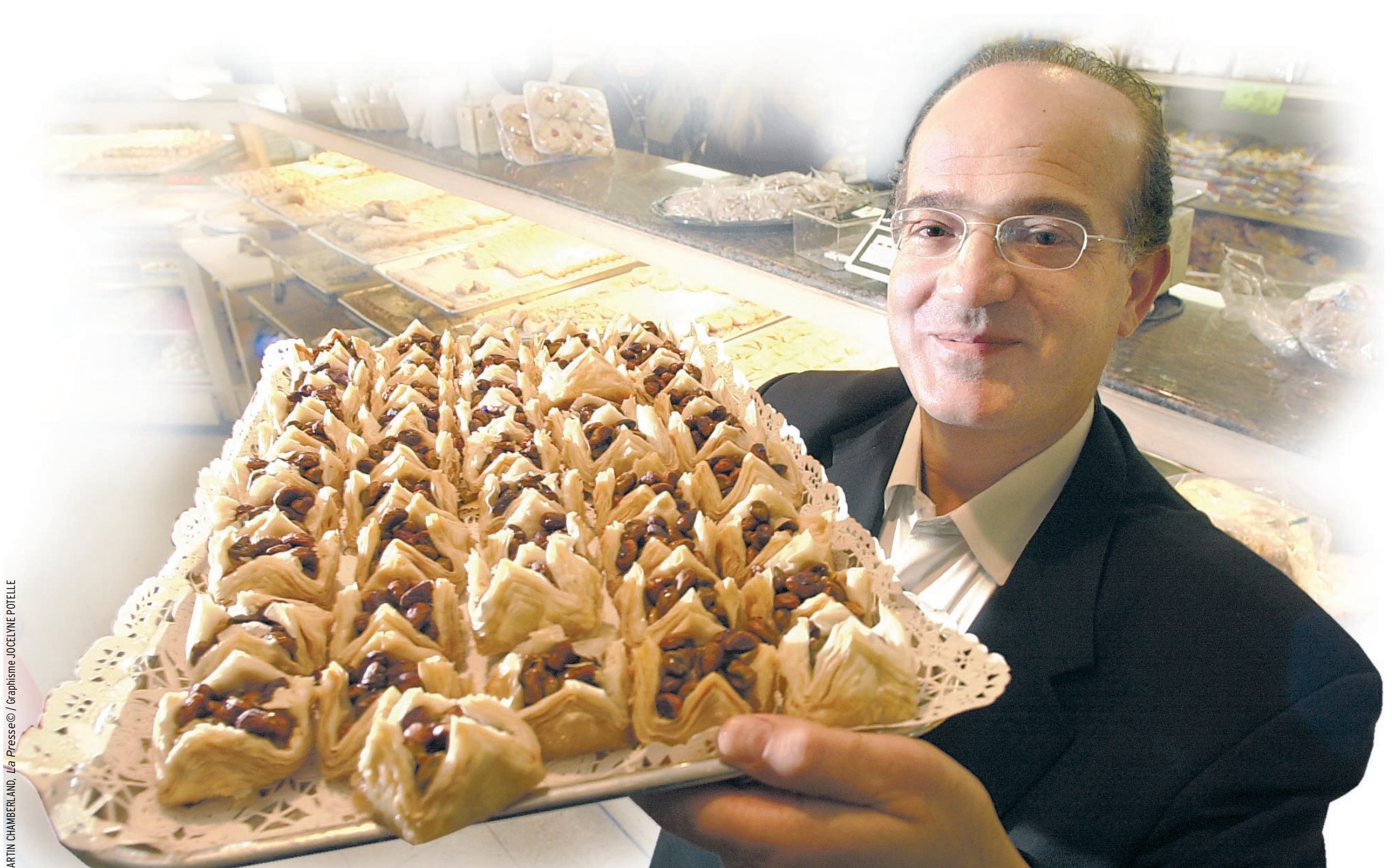
MARTIN CHAMBERLAND, La Presse © / Graphisme JOCELYNE POTTÉLLE