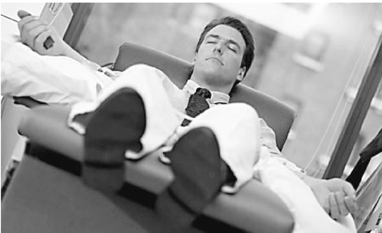
Après un infarctus, les patients ayant participé à des thérapies de groupe pour freiner les comportements destructifs (personnalité de type A — hostilité, agressivité, impatience, difficulté à se détendre) avaient moins tendance à recommencer.

Attribuer un effet durable à une mesure ponctuelle de la tension ar-