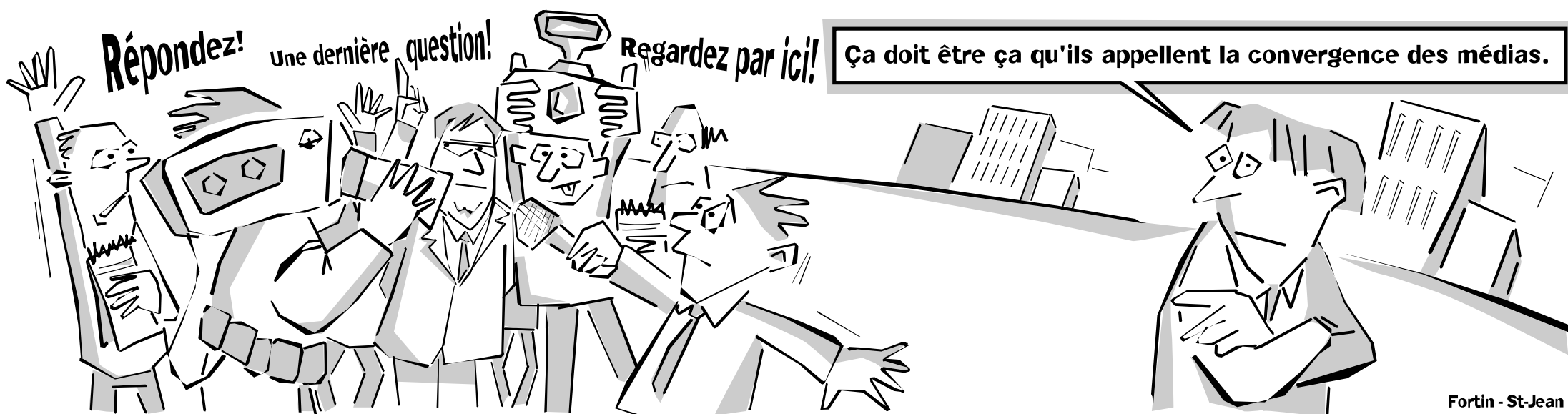
Fortin - St-Jean