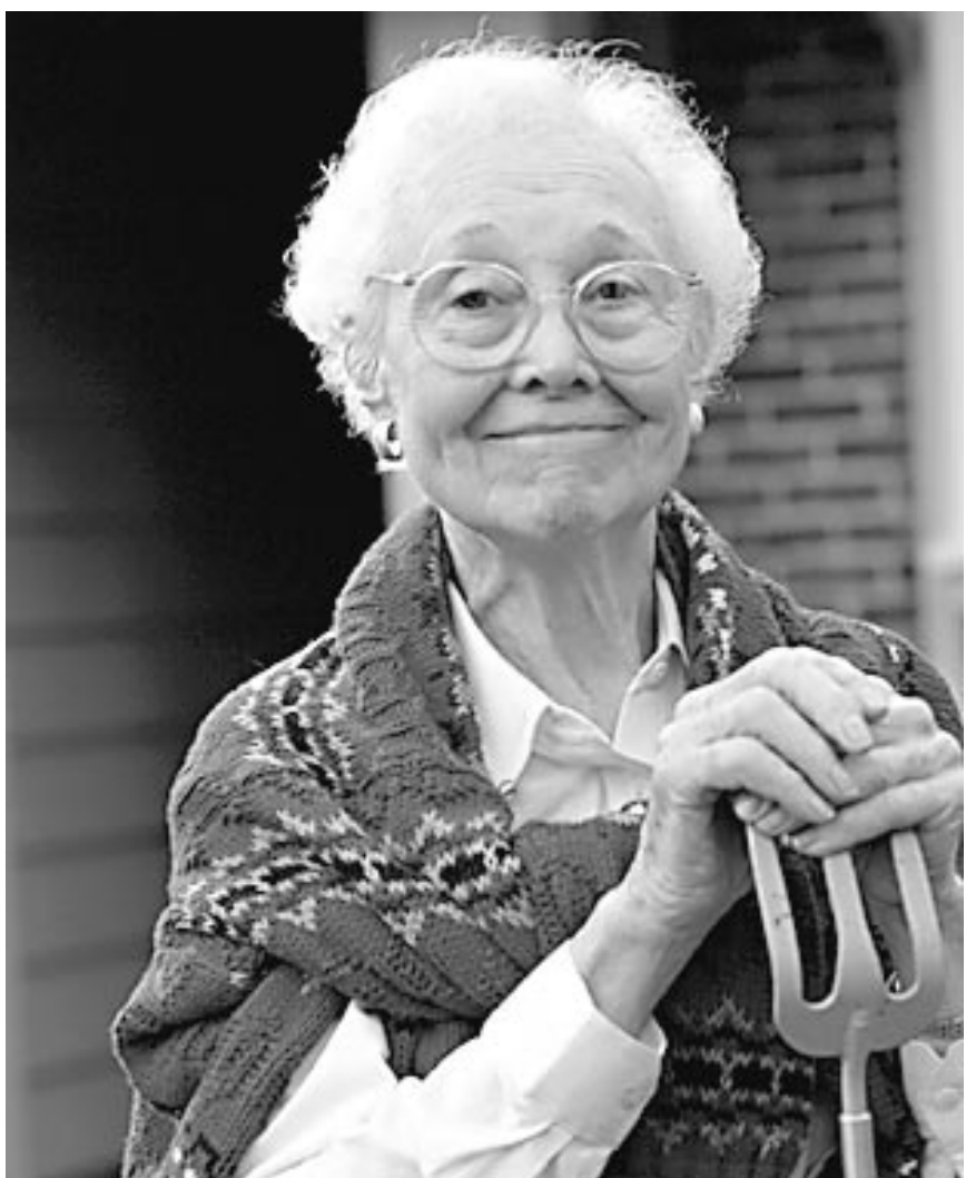
Les gènes de la longévité n'ont été découverts que chez les insectes. Le jour où ils le seront enfin chez l'homme, l'objectif sera de permettre aux personnes de vivre plus longtemps en meilleure santé.

« Certains centenaires ont fumé toute leur vie durant, d'autres sont trop gros », affirme un scientifique