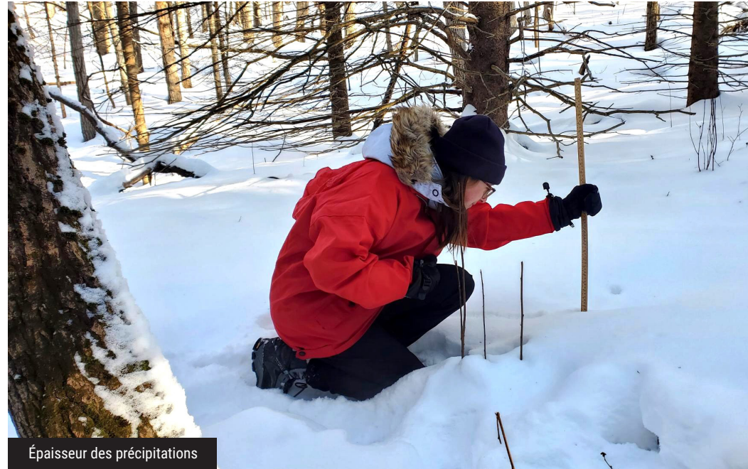
Épaisseur des précipitations

La mise sur pied du PSIÉ du parc du Mont-Bellevue est un projet de la réserve naturelle universitaire en devenir, chapeauté par Nature Cantons-de-l'Est, le Regroupement du parc du Mont-Bellevue et l'Université de Sherbrooke. Les étudiant·e·s de l'Université de Sherbrooke devront assurer le relais et mesurer les précipitations hivernales