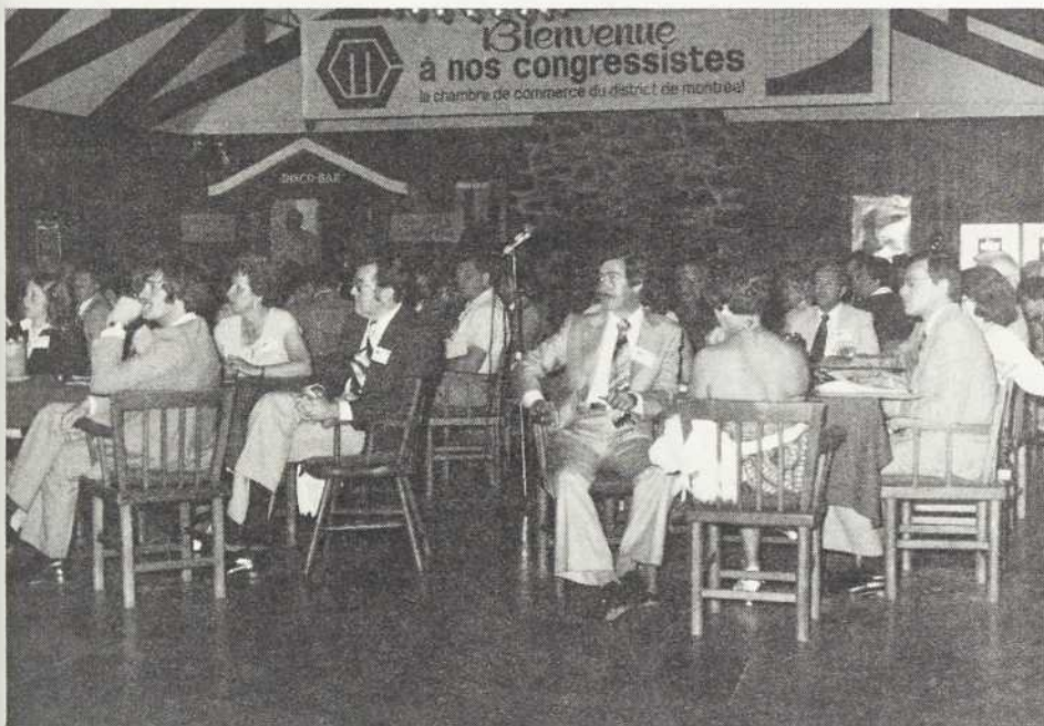
Une partie des congressistes, déjà regroupés en atelier, écoute attentivement les remarques d'un conférencier.

de constituer des dossiers qui alimenteront un programme d'action couvrant une période plus longue. Le dossier du présent congrès nous apparaît particulièrement substantiel, et nous croyons utile d'en prévoir la publication sans délai. Nous croyons utile aussi de prévoir l'exploitation de ce dossier par le biais de séminaires, colloques ou journées d'études, où nous traiterons à chaque fois d'une tranche limitée du dossier. Ce découpage permettra d'aller davantage au fond de chaque question, et selon le cas, de parfaire l'information des membres de la Chambre ou de déboucher sur des initiatives concrètes. A titre d'exemple, il est évident que l'identification des secteurs dont l'Etat devrait se retirer ou de ceux où le recours au "faire faire" s'impose, requiert plus que quelques heures de discussion.