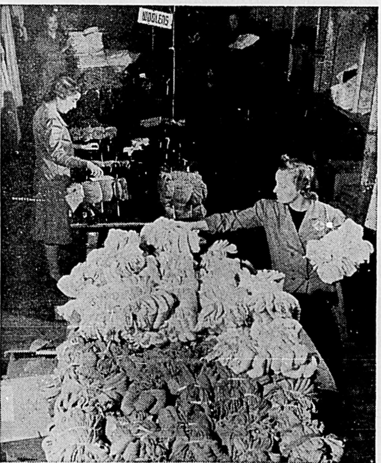
Les articles confectionnés dans les 185 sections de la Croix-Rouge de notre province sont inspectés, classés et emballés à la Maison de la Croix-Rouge à Montréal.