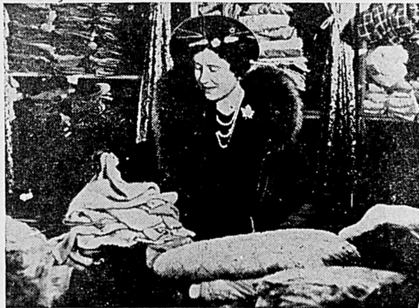
Sa Majesté la reine Elizabeth photographiée au cours d'une visite récente à un entrepôt de la Croix-Rouge en Angleterre. Elle a fait de grands éloges des articles confectionnés par les Canadiennes.