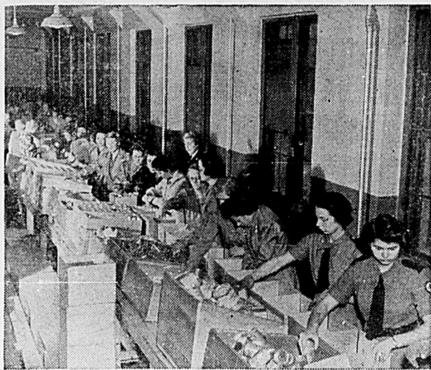
Plus de 47 pour cent du prochain budget de la Croix-Rouge servira à procurer des colis de vivres aux prisonniers de guerre. On voit ici une grande partie du grand atelier d'emballage de Ville LaSalle, où travaillent des centaines de volontaires.