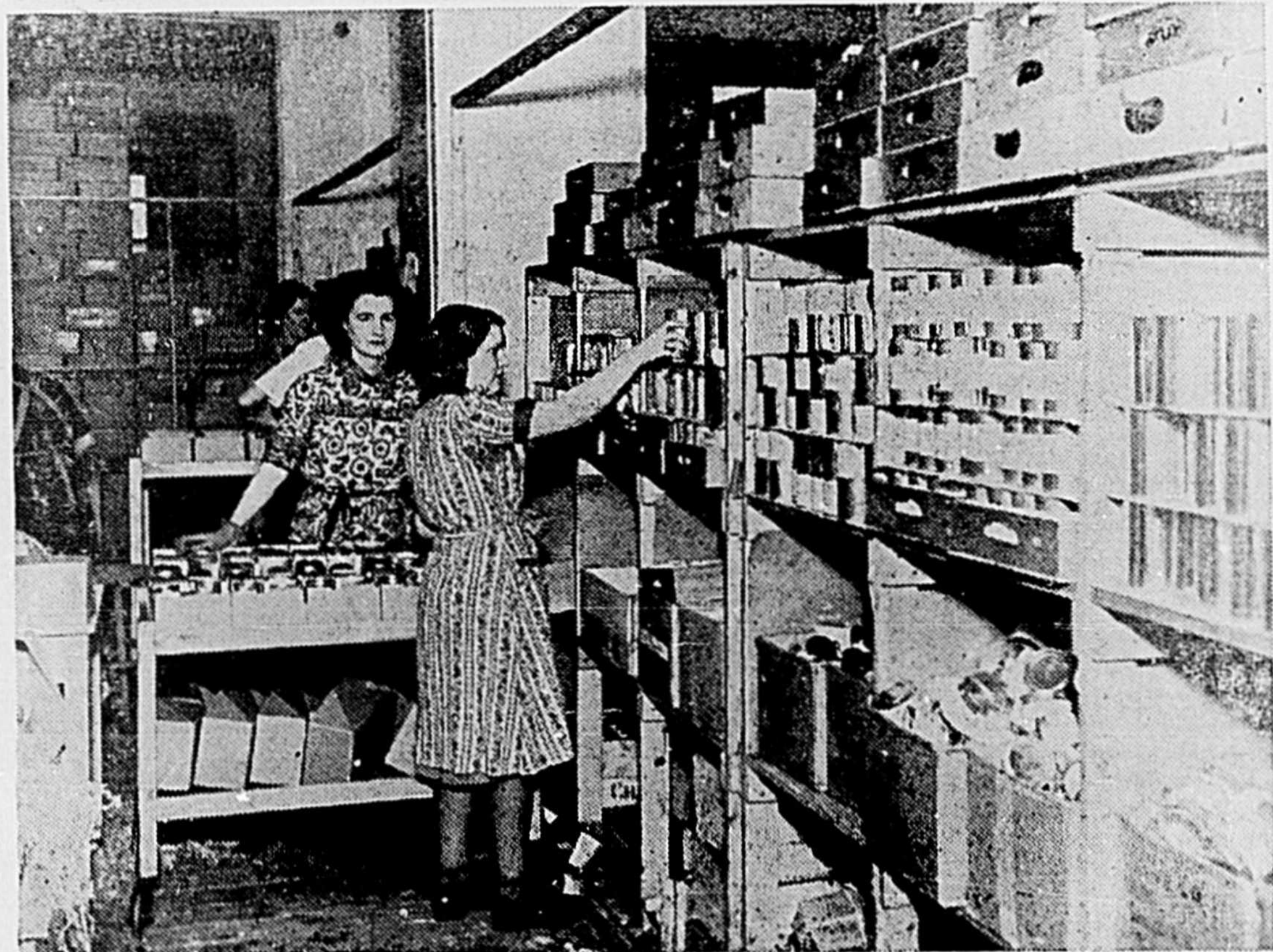
La Croix-Rouge canadienne, répondant à l'appel des milliers de victimes des bombardements aériens, leur a procuré vivres et vêtements. On voit ici un entrepôt de conserves en Angleterre.

On vient de publier les chiffres revus et corrigés du recensement de 1941. La population du Canada est de 11,506,655 habitants, dont 5,900,536 hommes et 5,606,119 femmes.