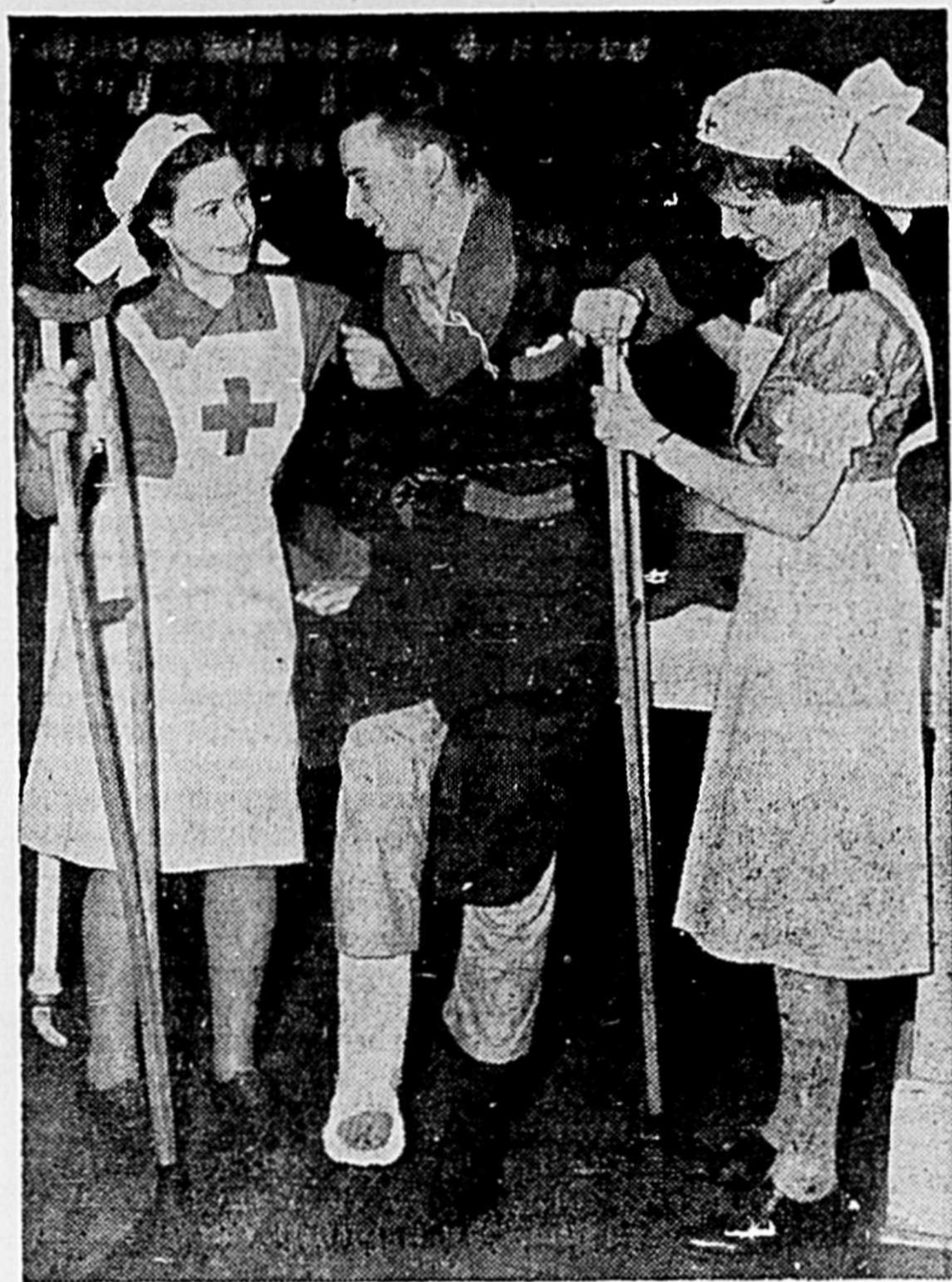
Un Canadien français, blessé dans le terrible engagement de Dieppe, est hospitalisé à Ste-Anne de Bellevue. Des infirmières auxiliaires de la Croix-Rouge lui procurent non seulement les soins mais voient à son confort et à son réconfort.