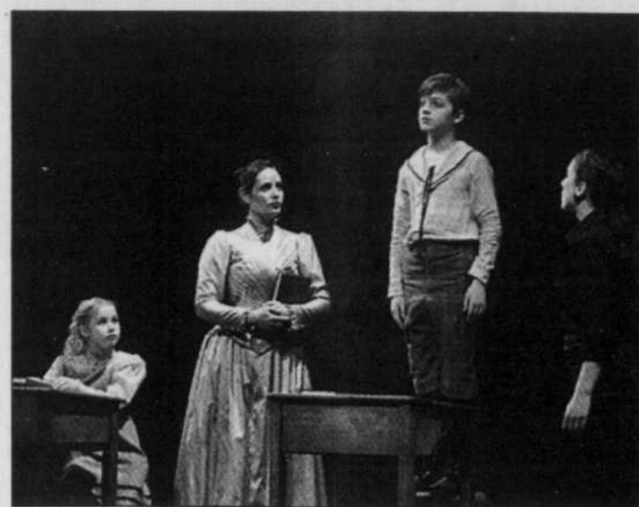
Flora et la gouvernante voient le jeune Miles chanter sa lamentation «Malo, Malo» (acte I, sc. 6), une scène clé de l'opéra The Turn of the Screw .