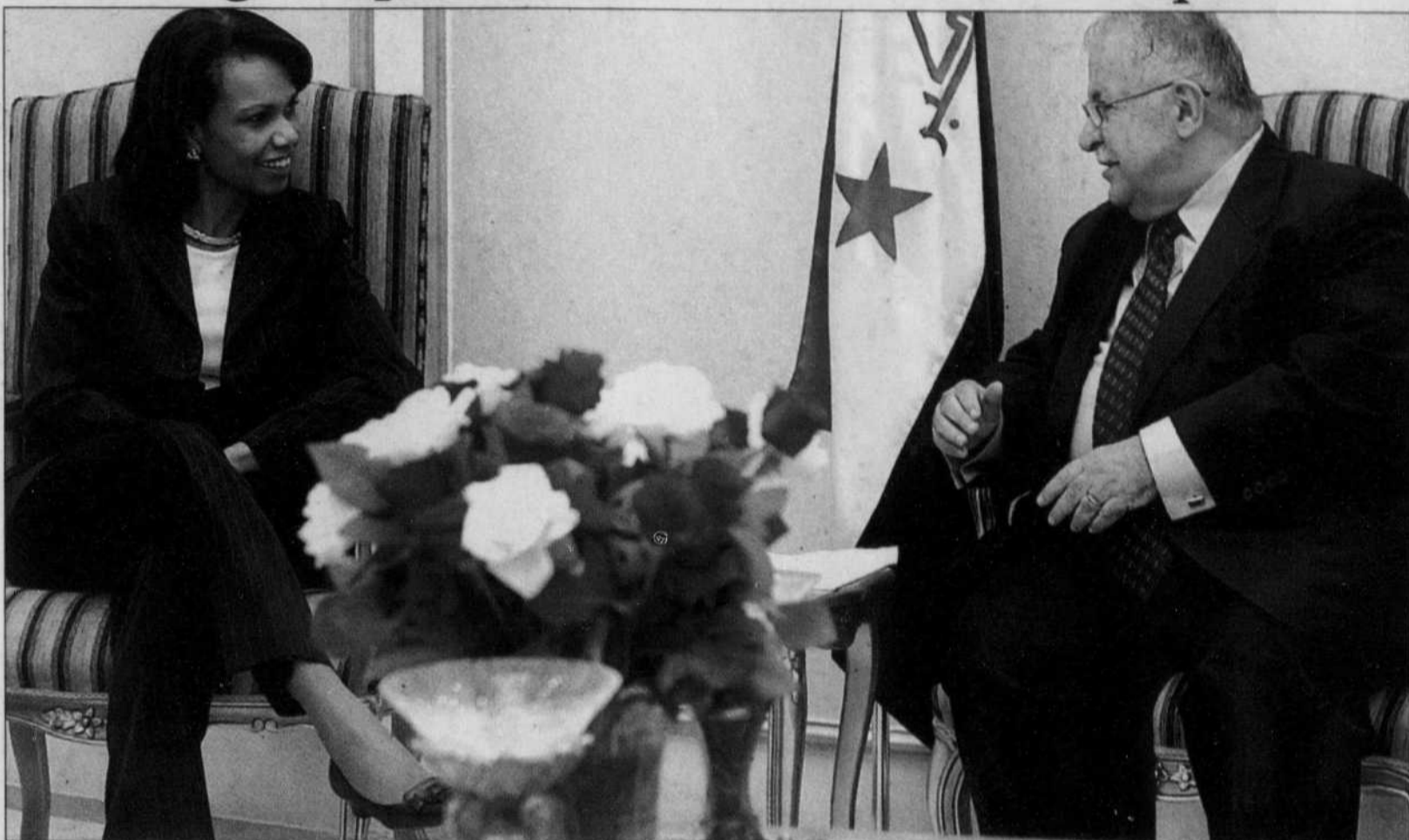
La secrétaire d'État américaine Condoleezza Rice et le président irakien Jalal Talabani, hier à Bagdad. Mme Rice et son homologue britannique Jack Straw ont effectué une visite-surprise en Irak dans le but d'aider les Irakiens à former au plus vite un gouvernement d'union nationale.

Visite-surprise de Condoleezza Rice et Jack Straw à Bagdad pour trouver une issue à l'impasse