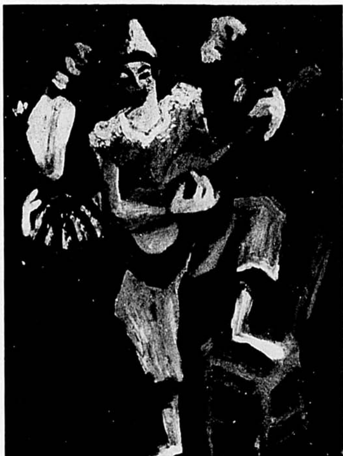
« Clowns »