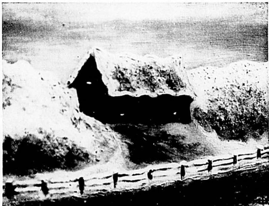
« La Grange à Séraphin »