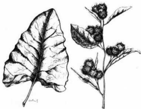
A gauche: une feuille de la base.— A droite: sommité fleurie.

J'ai remarqué que les feuilles de l' Arctium minus avaient des petits poils en dessous; ce sont donc des feuilles duveteuses, qui ont une certaine ressemblance avec celles de la rhubarbe