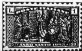
ITALIE Timbre de l'Année Sainte, 1925. Le pape ouvrant la porte sainte.