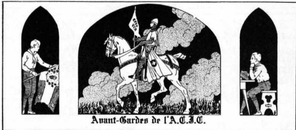
Avant-Gardes de l'A.C.J.C.