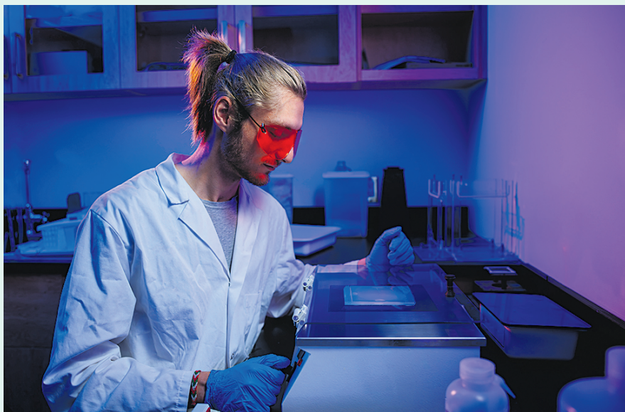
2 | Mercredi 8 janvier 2025

L'Université du Québec à Rimouski s'est une fois de plus illustrée à l'échelle nationale sur le plan de la recherche, en obtenant la deuxième position parmi les universités de sa catégorie selon la firme indépendante Research Infosource Inc. Chaque année, la firme établit un palmarès de la recherche au sein des établissements universitaires du Canada selon trois catégories, dont celle des universités offrant majoritairement des programmes de premier cycle comme l'UQAR. Depuis 2011, l'UQAR s'est retrouvée à onze reprises dans le top 3 des universités de sa catégorie. Le financement de la recherche en termes du montant total des octrois, le financement moyen par professeure et professeur, le financement moyen par étudiante et étudiant aux cycles supérieurs, le nombre total de publications dans des revues avec des comités de lecture, le nombre moyen de publications par professeure et professeur ainsi que le facteur d'impact des publications établi par l'Observatoire des sciences et des technologies sont les six critères sur lesquels repose le classement.