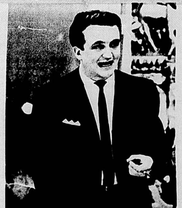
Certainement le débat le plus important de l'année à l'AGEUM!

La réunion se termina par le vote secret qui fut pris malgré le mécontentement de certains représentants qui auraient voulu dire ce que leurs confrères venaient de si brièvement nous exposer... Sur 42 votants, il y eut 22 pour 18 contre et 2 abstentions. A quand la prochaine réunion? ■