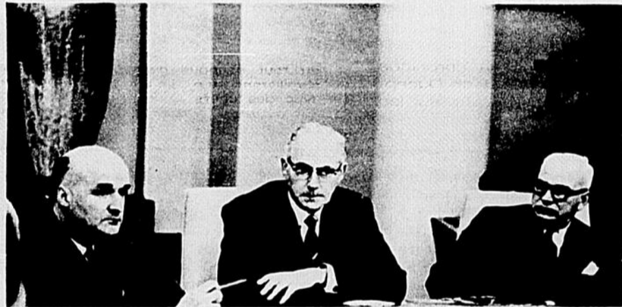
L'art... d'oublier l'essentiel dans les prises de position