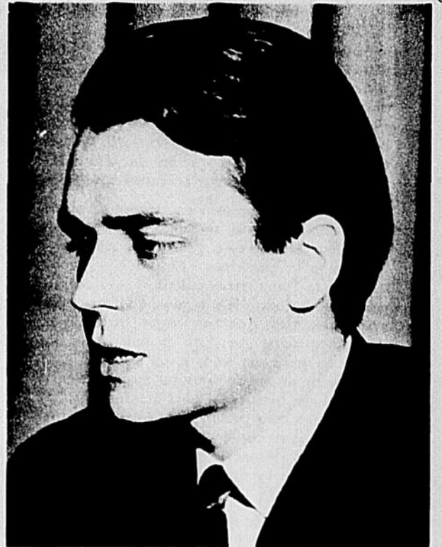
O ingratitude !...

La proposition du président de lettres visant à désapprouver M. Pelletier fut attaquée de front par toute l'assemblée. D'abord, lors du comité plénier, personne n'osa poser de questions; c'était à se demander si tous étaient d'accord avec ladite