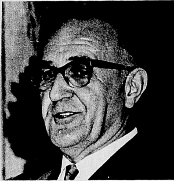
Yves Prévost, bâtonnier

Le bâtonnier dit concevoir la réaction de l'étudiant en droit qui semble préférer l'enseignement de la culture juridique. "Il est plus facile de retenir quelques grandes idées générales que de s'astreindre à apprendre des règles positives. L'effort à développer n'est pas le même. C'est un autre exemple de l'application de la loi du moindre effort; loi la plus amendée dans le monde."