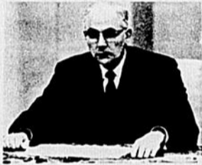
Le corps médical et le gouvernement: responsables des ajournements du projet.

• Un élément important manque au tableau: les projets de M. Kierans au ministère de la Santé. Celui-ci doit faire connaître sa décision face au Centre médical d'ici le printemps.