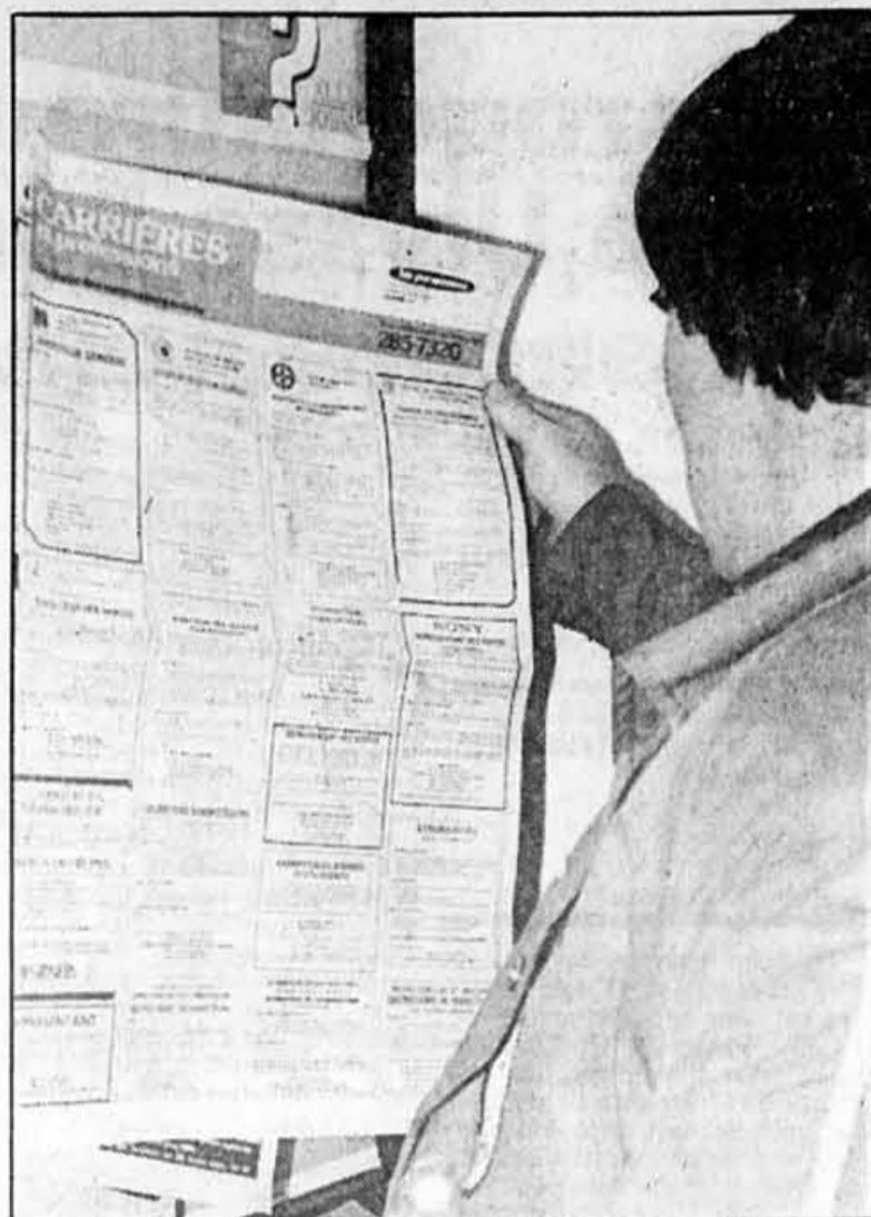
Pendant qu'au Québec le taux de chômage oscille autour de 11 p. cent, en Suisse, il s'établit à moins de 1 p. cent.

Un cliché veut que la Suisse ait exporté son chômage en renvoyant chez eux, il y a dix ans, des dizaines de milliers de travailleurs étrangers. Il est effectivement vrai que des 300 000 emplois perdus lors de la crise de 1974-76, environ les deux tiers ont été «absorbés» par le départ de travailleurs étrangers, constatent les économistes. Mais ils ajoutent que ces départs ont, d'un autre côté, accentué la récession en diminuant la demande intérieure. De plus, les rapports notent que les étrangers qui sont partis représentaient une main-d'oeuvre bon marché.