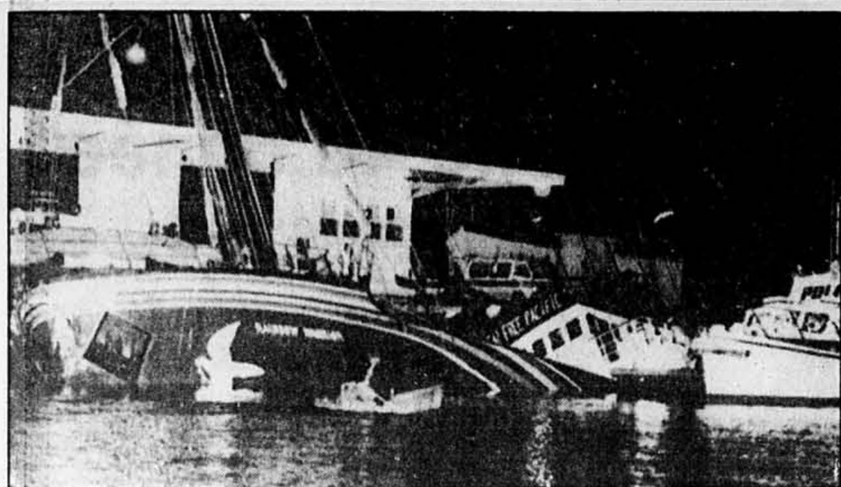
C'est dans cet état que s'est retrouvé le «Rainbow Warrior» de Greenpeace, à Auckland, en Nouvelle-Zélande.