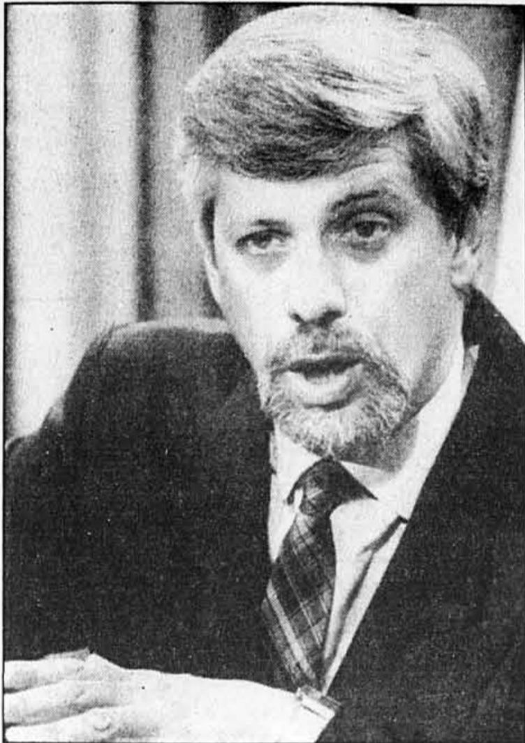
« Il faut que le débat ne s'éteigne pas au milieu de l'été », lançait le chef péquiste, M. Pierre Marc Johnson.