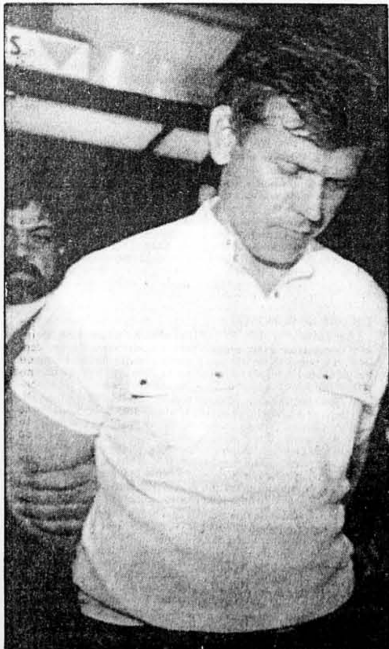
Guennadi Zakharov, le Soviétique qu'on voudrait bien échanger contre le journaliste Nicholas Daniloff.