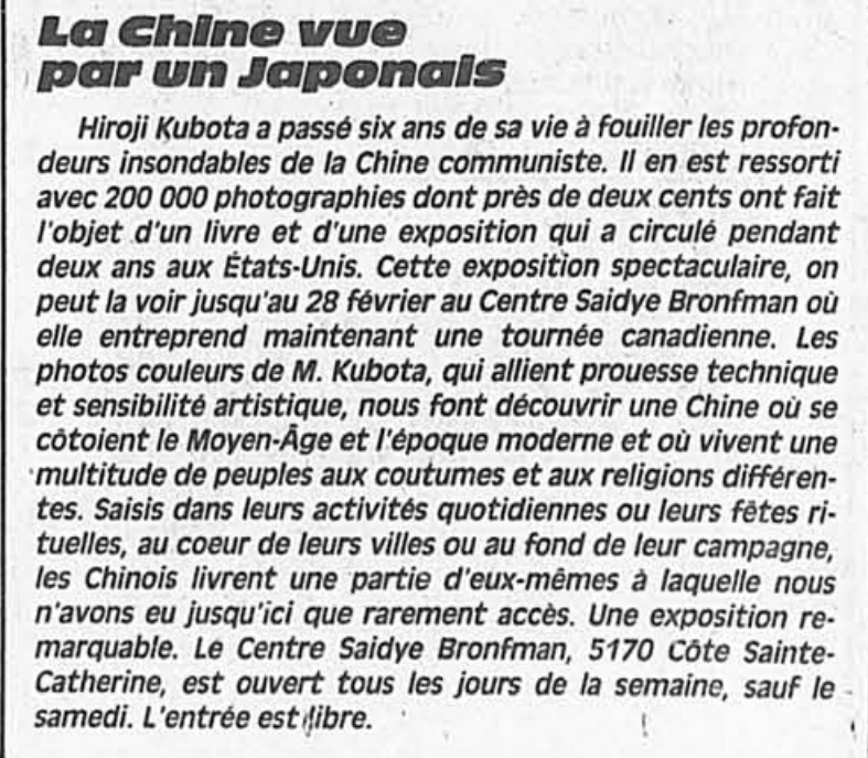
La Chine vue par un Japonais Hiroji Kubota a passé six ans de sa vie à fouiller les profondeurs insondables de la Chine communiste. Il en est ressorti avec 200 000 photographies dont près de deux cents ont fait l'objet d'un livre et d'une exposition qui a circulé pendant deux ans aux États-Unis.

À l'église des Pères du Saint-Sacrement, 500 est, rue Mont-Royal, il y aura une heure mariale, à 19 h 30, le mercredi 24 février, au Centre.