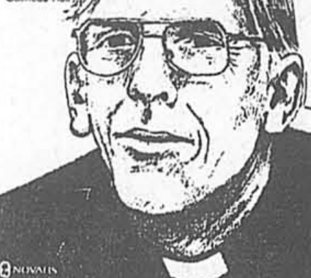
Le message social de Mgr Adolphe Proulx évêque de Gatineau-Hull

Un livre qui perpétue la mémoire et les actions de Mgr Adolphe Proulx.