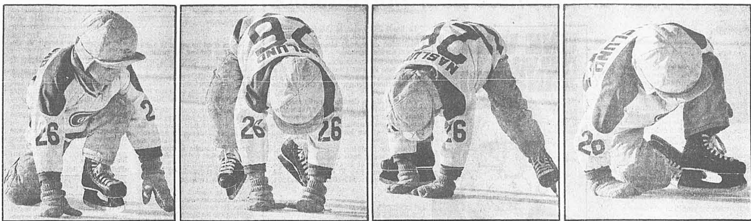
La bonne volonté ne fait pas défaut mais ce jeune patineur manque un peu de technique.