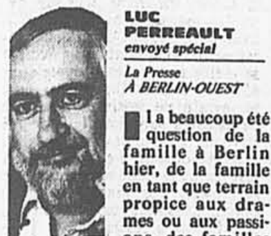
LUC PERREULT envoyé spécial La Presse À BERLIN-OUEST

Il a beaucoup été question de la famille à Berlin hier, de la famille en tant que terrain propice aux drames ou aux passions, des familles d'acteurs et du cinéma tourné en famille.