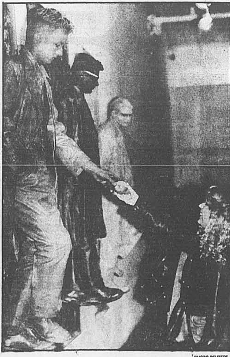
L'un des artistes reçoit une pomme d'une main compatissante.

Après New York, l'exposition prendra le chemin d'Athènes. Après, Woodrow à l'intention de faire quelque chose «qui serait comme des meubles vivants». Il pense aussi explorer le thème «de la nourriture vivante».