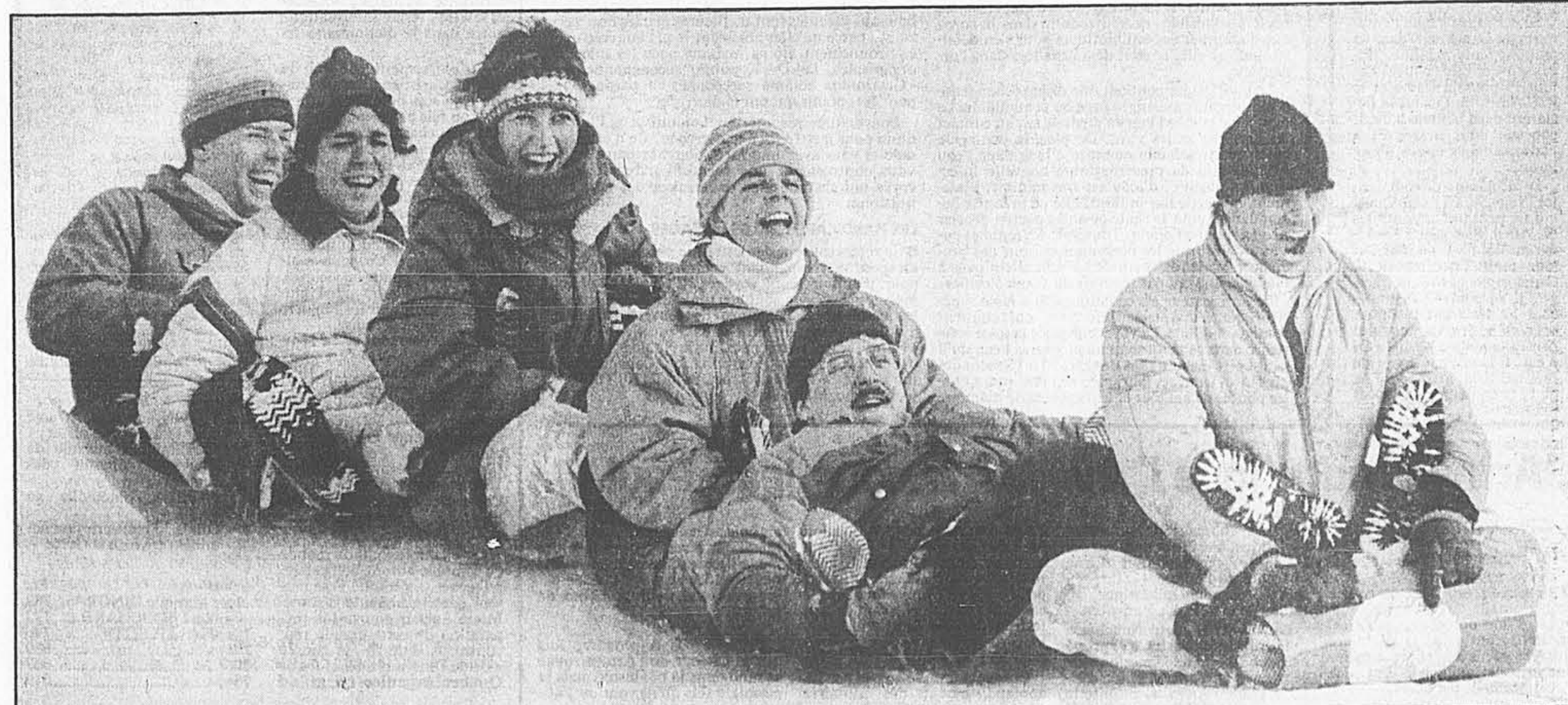
Sur le Mont-Royal, le plaisir est collectif en « tapis magique ».