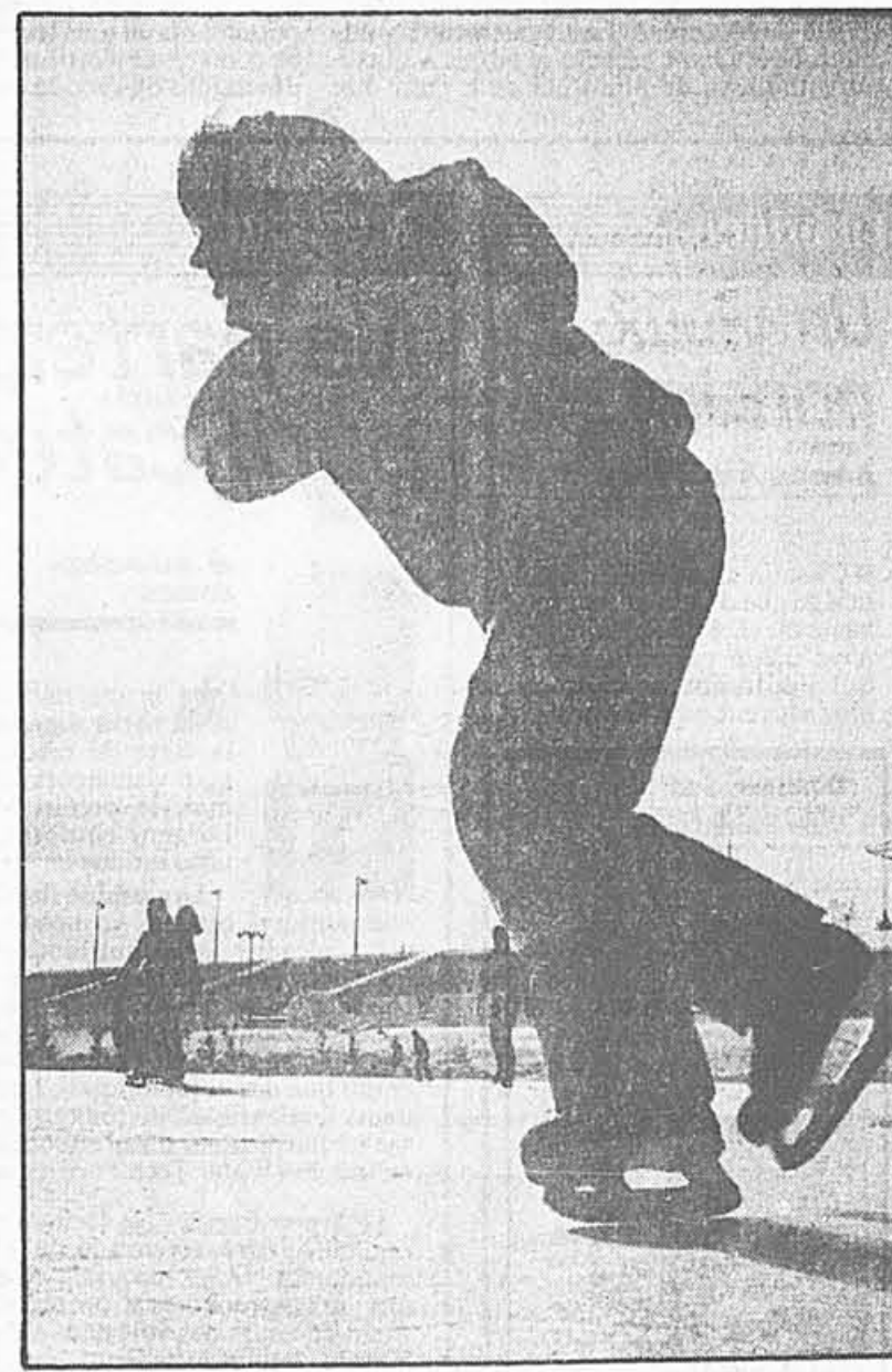
À la brunante, lorsque le soleil quitte peu à peu l'horizon, ces patineurs apparaissent comme des silhouettes sur la patinoire de bassin olympique de l'île Notre-Dame.