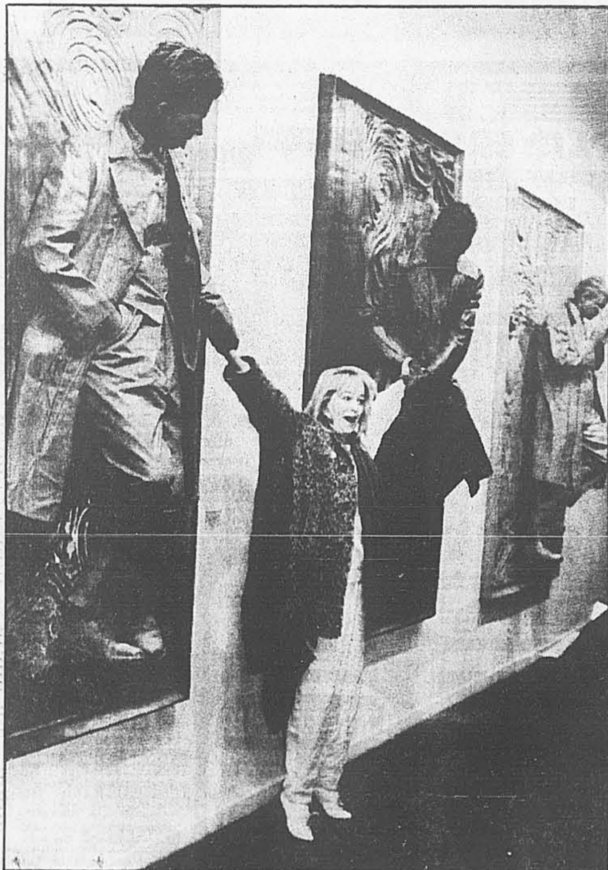
Deux des artistes «exposés» s'intéressent à une visiteuse.

L'un d'eux, enduit de peinture noire, est harnaché et pend d'une toile accrochée au mur