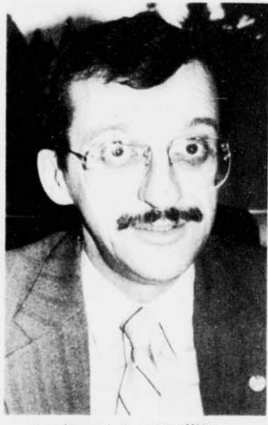
Le député Yvon Vallières