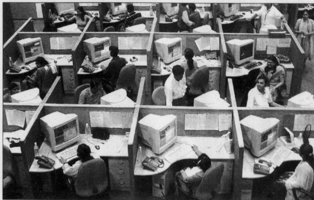
Les bureaux indiens de CGI devraient bientôt fournir du travail à un millier de personnes, au lieu de 650 aujourd'hui. Mais CGI se défend bien de vouloir désertier le Québec au profit de pays en voie de développement où la main-d'œuvre qualifiée est meilleur marché.

La popularité grandissante de l'impartition — ou sous-traitance — auprès des gouvernements, des grandes entreprises de services et même des manufacturiers constitue une excellente nouvelle pour CGI qui s'estime bien positionnée pour tirer profit de la manne à venir, au Québec ainsi que dans les autres provinces.