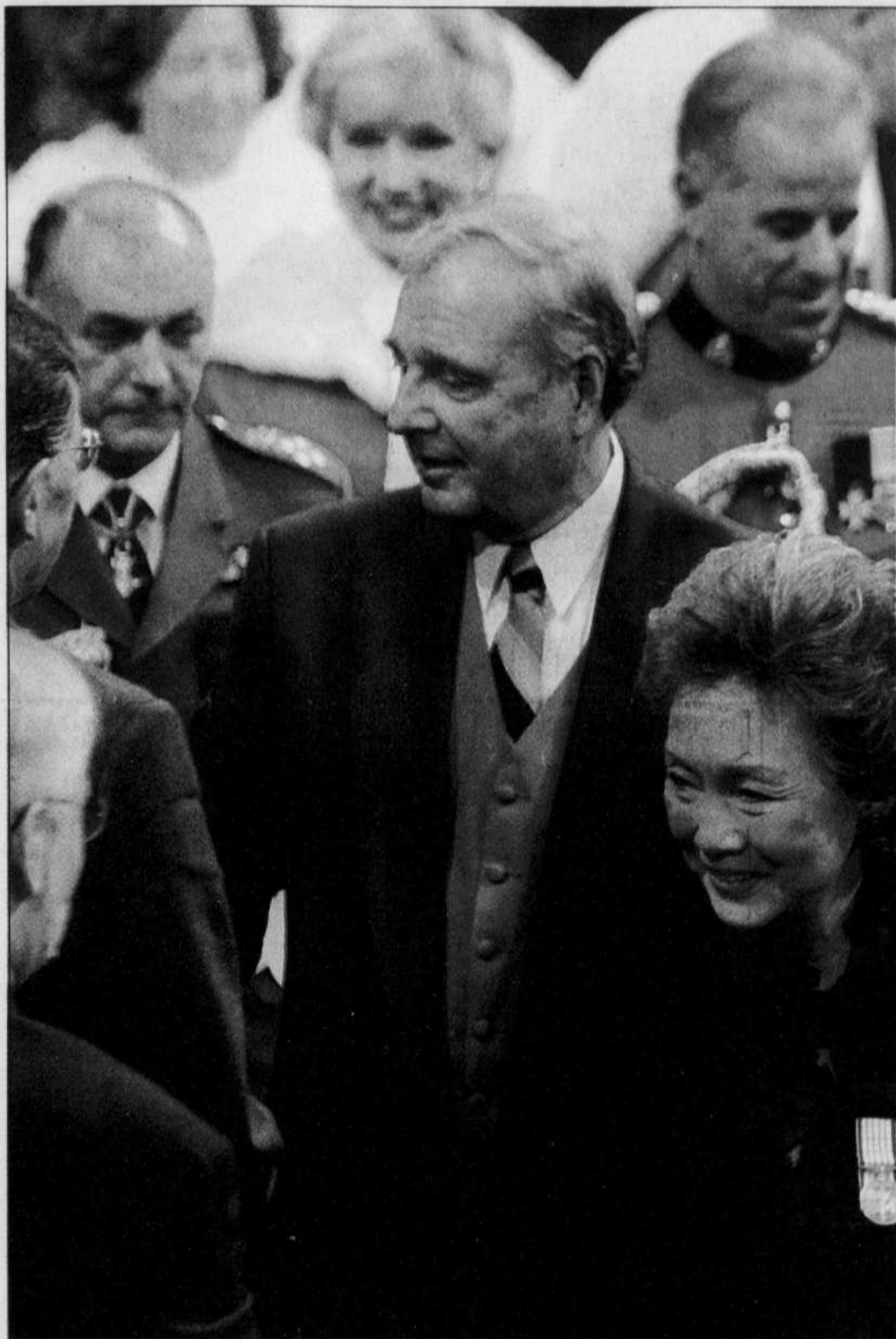
Le premier ministre Paul Martin et la gouverneure générale Adrienne Clarkson quittent l'enceinte du Sénat après la lecture du discours du Trône, suivis du chef d'état-major de la Défense, le général Ray Henault, de la juge en chef de la Cour suprême, Beverley McLachlin et du commissaire de la Gendarmerie royale du Canada, Giuliano Zaccardelli.