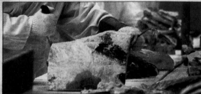
Établir la traçabilité du bœuf entre la ferme et l'assiette du consommateur préoccupe moins l'UPA que la baisse de revenu de ses membres.