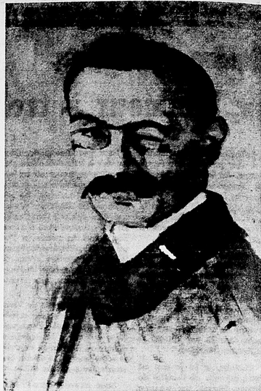
PORTAIT DE L'ARTISTE PAR LUI-MEME (1904) L'une des toiles prêtées par le Musée des Beaux-Arts de Bordeaux. Elle représente une exception dans l'oeuvre de Marquet. En effet, comme en témoigne cette toile, Marquet en 1904 promettait d'être l'un des grands portraitistes du siècle. Mais...

Lorsqu'on regarde son oeuvre subséquente, on se surprend de voir que cette première révélation fut celle de l'impressionnisme. En effet, les oeuvres de Marquet dans lesquelles nous retrouvons tant soit peu de la manière impressionnante sont extrêmement rares. Cependant on retrouve une influence indirecte de l'impressionnisme dans la recherche fondamentale qui préoccupera les fauves. C'est la découverte de la couleur comme moyen fondamental de l'expression picturale. Mais les fauves, s'inscrivant dans la tradition de Gauguin, tendent à utiliser la couleur non plus pour exprimer l'impression fugitive mais pour exprimer