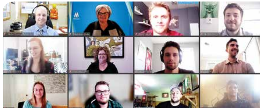
Trois finissantes et sept finissants de l'École de foresterie de l'Université de Moncton, campus d'Edmundston ont enfilé leur jonc d'argent de l'Institut forestier du Canada.

« Puisque le coronavirus s'est invité dans nos vies, nous célébrons aujourd'hui de façon virtuelle, un peu à la façon dont l'année universitaire s'est passée et que nous avons vécue ensemble. Il faut dire que la forêt et la nature nous apprennent