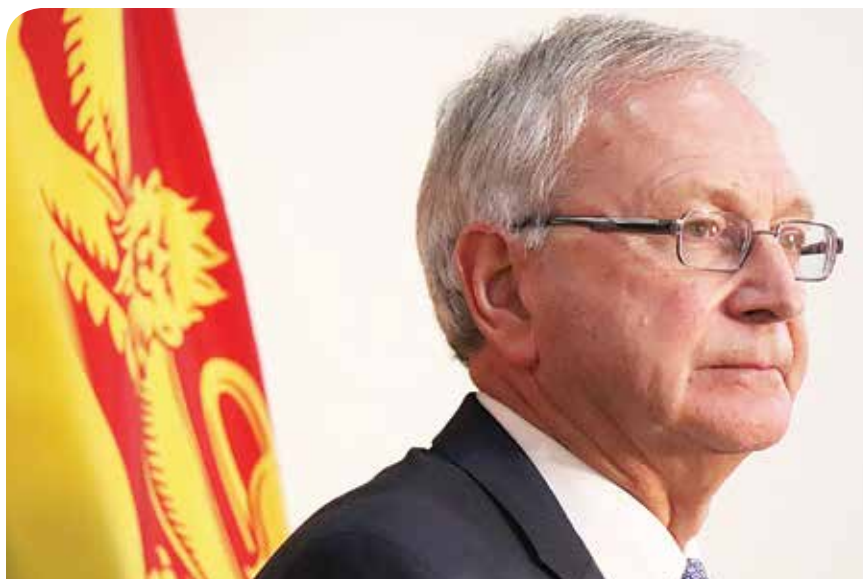
Le premier ministre Blaine Higgs souhaite l'ouverture de la frontière du Maine d'ici la fin juillet.