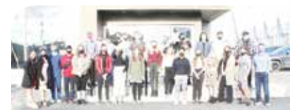
Voici les élèves qui ont pris part au projet artistique réalisé à la PAJS. Photo contribution

encan silencieux a eu lieu au cours des dernières semaines au Palais Centre-Ville, à Saint-Quentin. L'activité a permis d'amasser un peu plus de 1700 $.