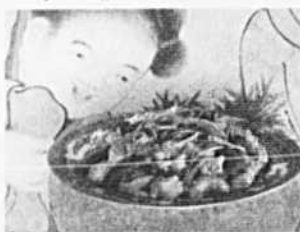
Hors-d'œuvre ou élément de repas chinois, ces boulettes vous raviront!

Découvrez gratuitement, chez vous, pendant 10 jours, tous les secrets de " La Cuisine Chinoise ".