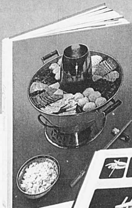
Un grand volume de 8 1/2" x 11" 206 pages 100 illustrations en couleur

En profitant de cette offre d'essai gratuit, vous ne vous engagez nullement à acheter quoi que ce soit. Commandez votre exemplaire dès aujourd'hui, en postant le bon ci-joint ou en écrivant aux Editions TIME-LIFE, Dép. 0706, C.P. 160, Toronto, Ontario, M5C 2J2.