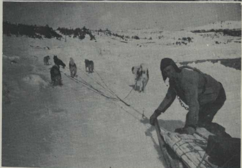
Le charriage sur la Côte Nord.