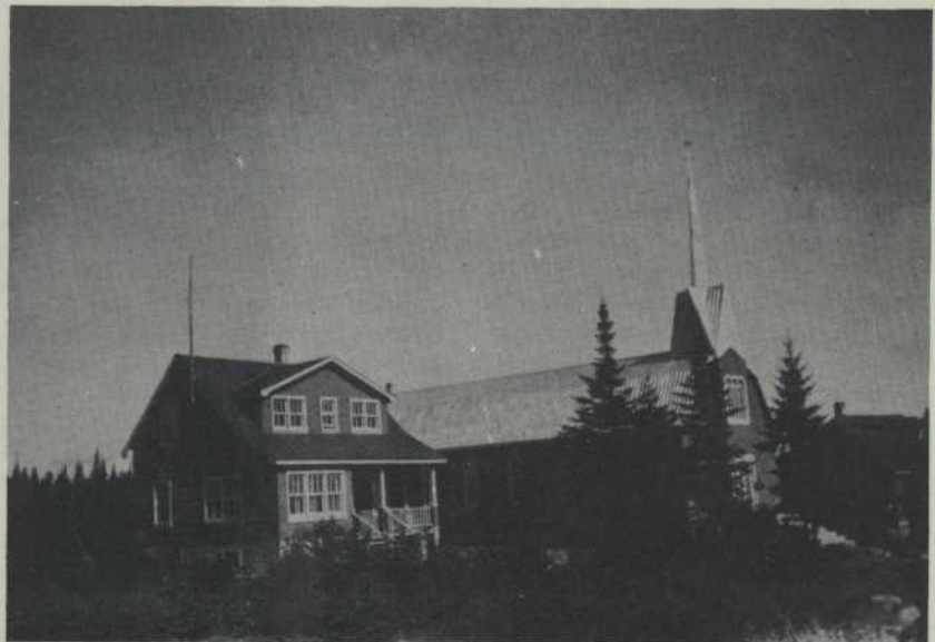
Église et presbytère (Tête-à-la-Baleine).

C'est donc avec autant de plaisir que d'espoir que, répondant au désir de Monseigneur et du bon Père Dionne, o.m.i., qui dessert Tête-à-la-Baleine et quelques autres postes, je suis parti, fin d'avril, pour fonder une