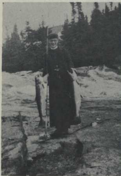
Le Père Dionne, o. m. i., devenu « pêcheur », tout court.

« Terres de Caïn ». Le temps s'est chargé de réduire la dureté de ce jugement.