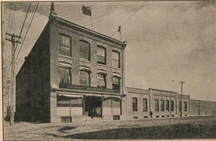
Etablissement Revillon Frères Ltée à Edmonton.