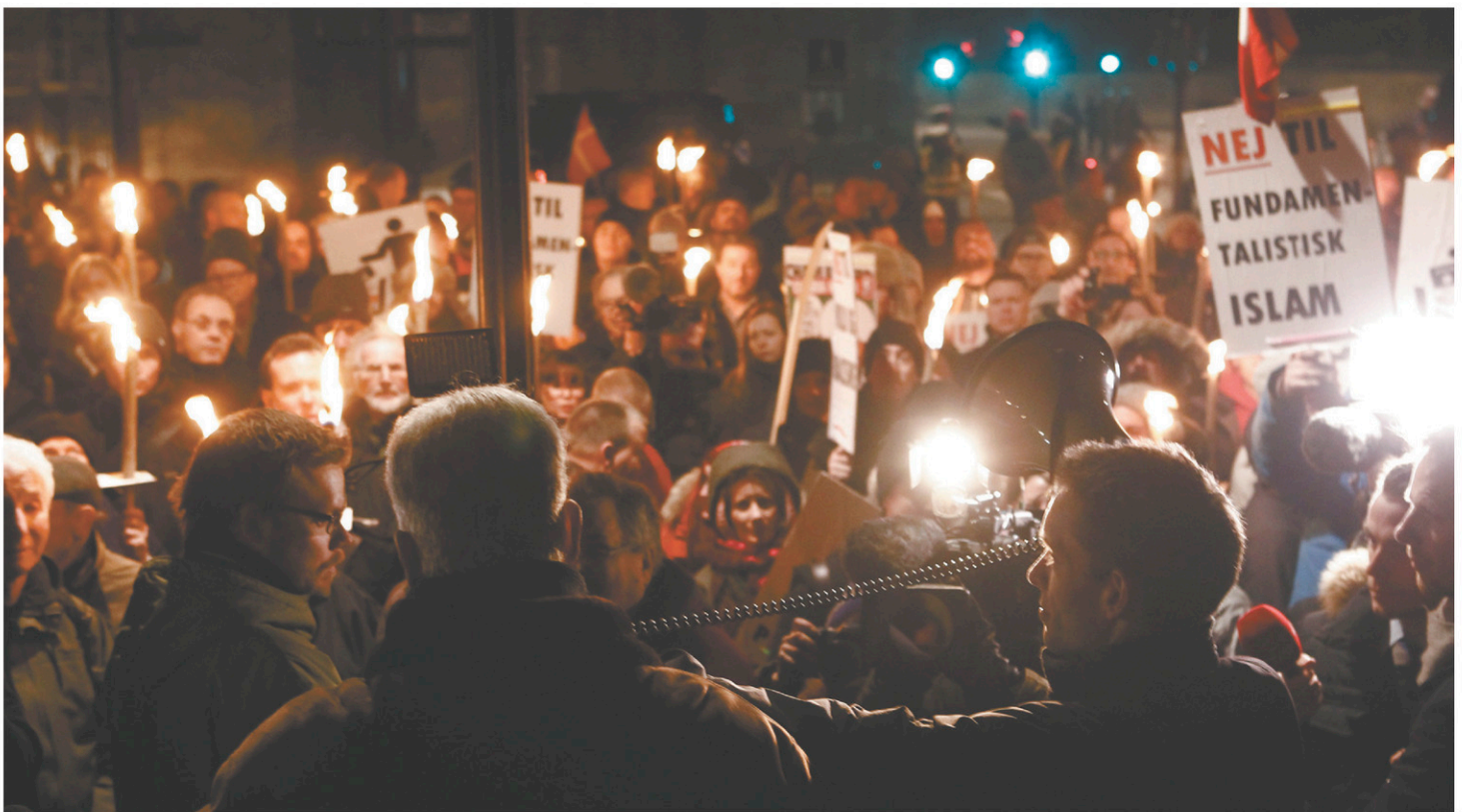
Des Danois anti-islam, membres de l'association PEGIDA, manifestaient à Copenhague en 2015. Le parti social-démocrate a fait un virage à 180 degrés sur la question de l'immigration, notamment afin de séduire l'électorat des classes populaires.

Depuis trois ans, le parti a voté la plupart des mesures adoptées au Parlement de Christiansborg pour restreindre l'immigration. En mai dernier, c'est sans hésitation que les élus sociaux-démocrates se sont prononcés en faveur