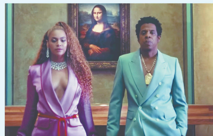
Beyoncé et Jay-Z au musée du Louvre YOUTUBE