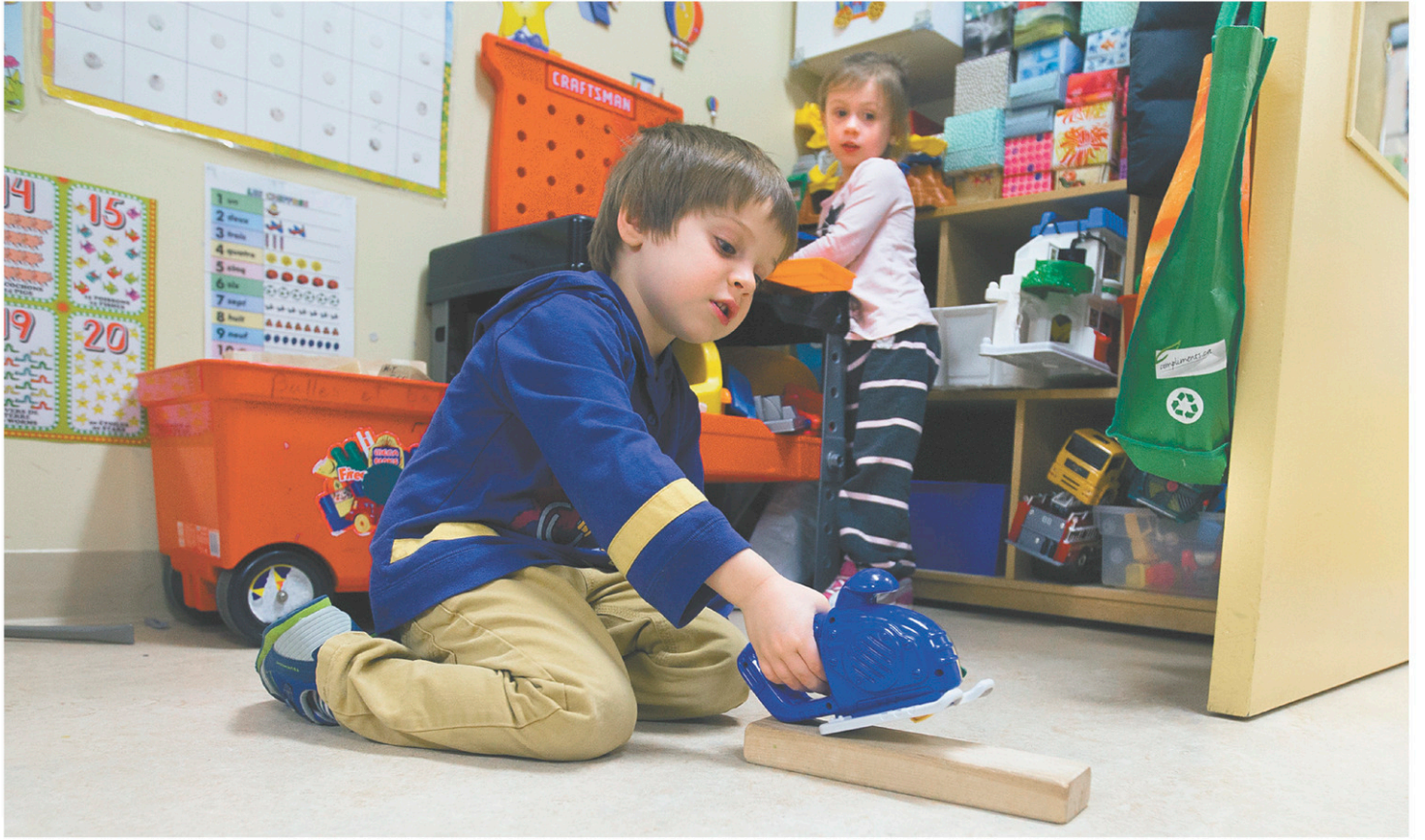
Dimanche, sur les réseaux sociaux, de nombreux parents se sont dits soulagés d'avoir à nouveau accès à leur service de garde, mais certains n'ont pas caché leur nervosité face à ce retour à la normale.