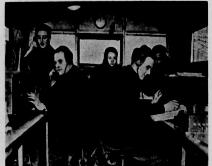
Dans toutes les bases de T.S.F. érigées pour la Royal Air Force, les opérateurs se tiennent en communication avec des avions qui sont souvent à des milliers de milles.

Les Tablettes Baby's Own soulagent rapidement la plupart des petites maladies infantiles: troubles de la digestion, constipation, fièvre légère, diarrhée, dérangements d'estomac, coliques, légers crampes et rhumes. Essayez-les, 25 cents. Votre argent vous sera remboursé si elles ne sont pas efficaces.