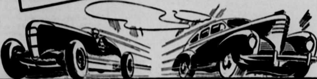
VOUS A L'ÉPREUVE SUR LES PISTES DE COURSE POUR VOTRE SÉCURITÉ SUR LA ROUTE!

LES PNEUS FIRESTONE A PLUS BAS PRIX! En plus de ce nouveau et sensationnel pneu Champion, les marchands Firestone ont trois autres pneus à plus bas prix. le "HIGH SPEED", le "STANDARD", le "SENTINEL". Quel que soit le prix que vous désirez payer pour un pneu, allez chez votre marchand Firestone avoisinant, et voyez les subimes qu'il a à vous offrir pour vous aider à économiser de l'argent.