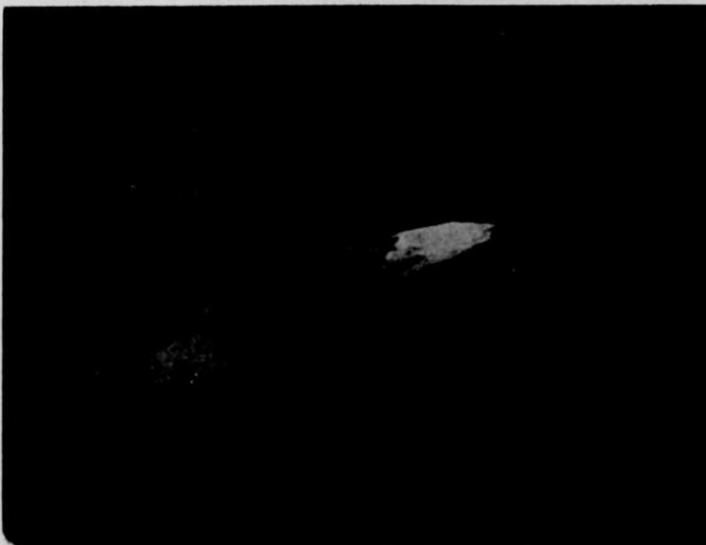
Photo prise du bombardier anglais qui coula un sous-marin. A la surface de la mer se répand l'huile du submersible, preuve de sa fin prochaine. Le pilote anglais qui remporta cette victoire sur l'ennemi a pris la photo.