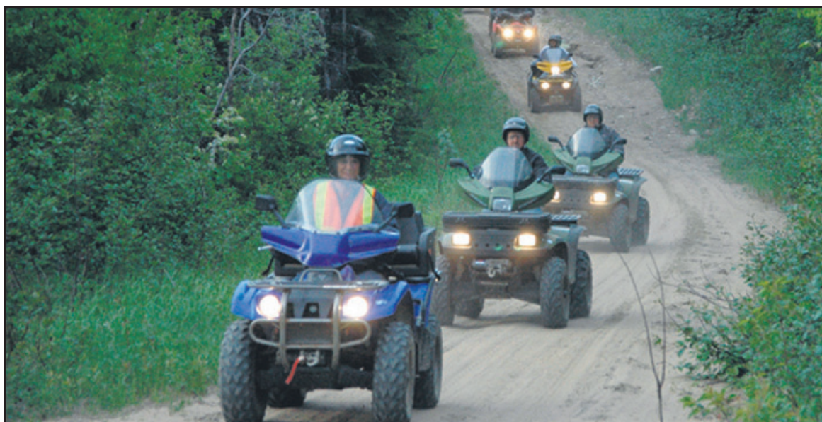
Ce sont au-delà de 200 quadistes qui sont attendus à Forestville du 30 juin au 2 juillet pour la Jamboree d'été de la Fédération québécoise des clubs quads.

« En fait, le principal « point sensible » demeure l'hébergement, pour le reste, soit les activités « hors sentier » telles que le vin d'honneur et le souper du samedi soir, nous attendons quelques confirmations de la Ville pour