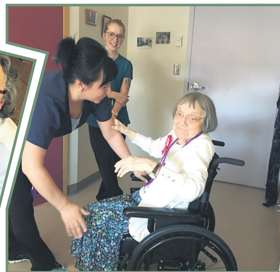
Tout le personnel du CHSLD des Bergeronnes a souhaité bon anniversaire à la centenaire.