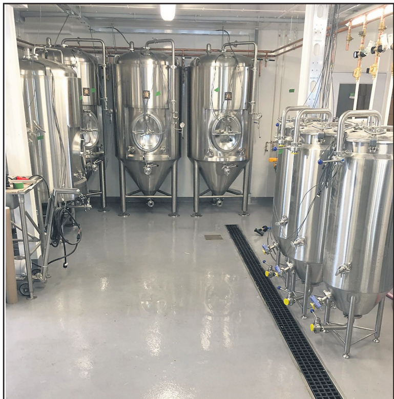
La salle de brasse a été entièrement rénoverée.