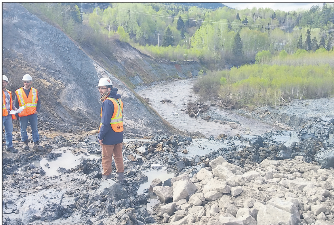
La direction régionale du MTMDET évalue la possibilité de faire travailler les équipes des Constructions SRV 24h sur 24.