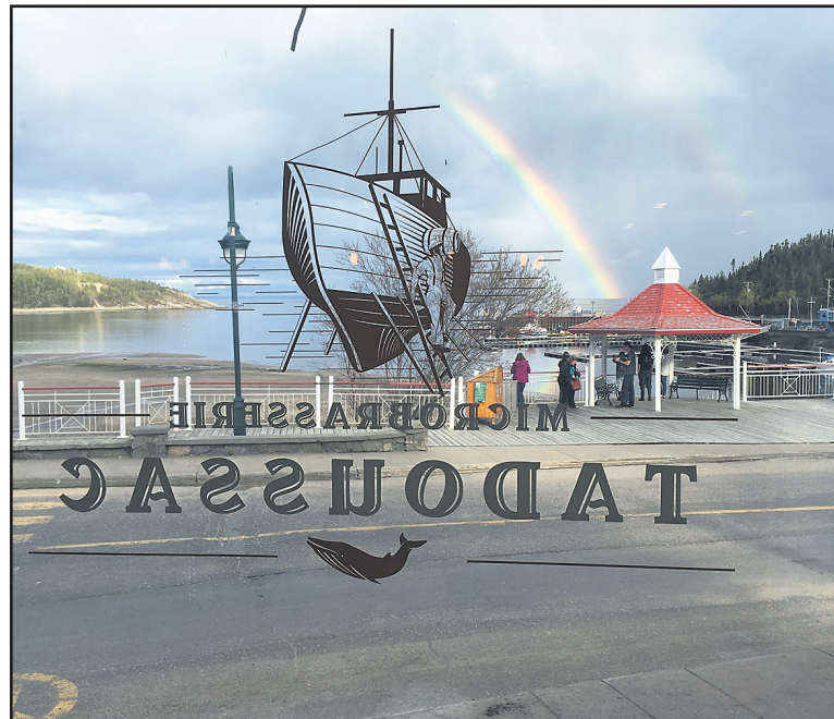
Après trois années d'efforts, voilà que le projet prend forme et que l'entreprise est enfin installée et prête à opérer.

L'idée de départ remonte il y a trois ans. Un paquet d'idées se sont enchaînées dans ce projet avant que l'équipe soit installée où elle se trouve actuellement. Rappelons qu'à l'été 2016, la Microbrasserie avait lancé sa première création, la Tadoussac Pale (Wh)Ale, qui était vendue au Café Bohème de Tadoussac. Aujourd'hui, sur place, c'est plus d'une dizaine de bières qui pourront être dégustées à la microbrasserie, dans un magnifique décor. Les brasseurs sont en action afin de tester la qualité de chaque sorte de bière.