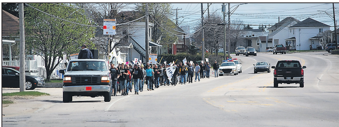
En grève depuis mercredi dernier, les 175 000 travailleurs de l'industrie de la construction du Québec ont manifesté partout. Ceux de la Haute-Côte-Nord ont choisi de le faire à Forestville.

De son côté la Fédération des chambres de commerces du Québec