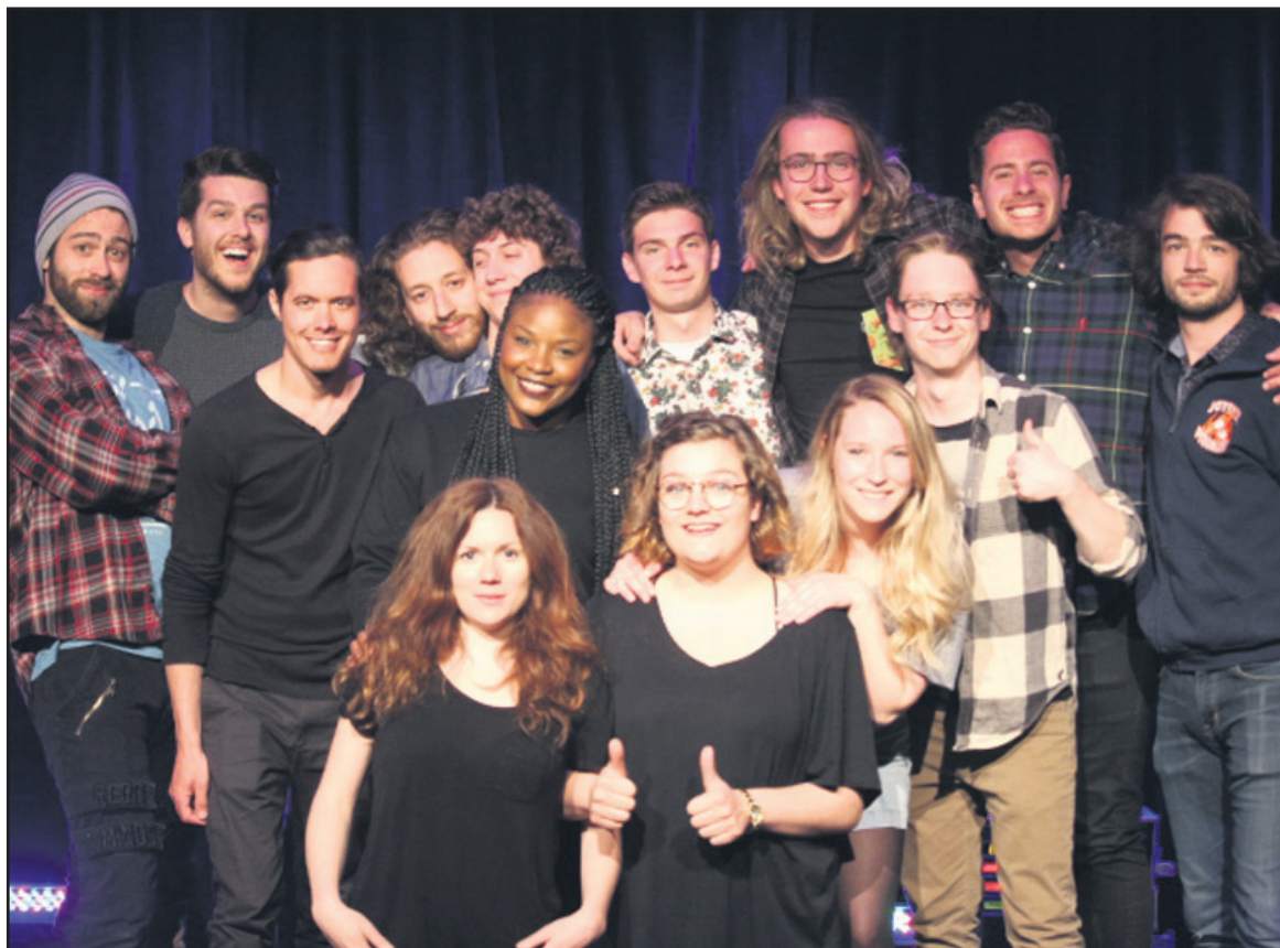
Les 14 finissants de l'École nationale de l'humour ont très bien complété ce Week-end de l'humour.

Le samedi, Tadoussac a reçu la visite de Fabien Cloutier, de passage avec « Assume », son premier one-man-show. Un excellent spectacle, très différent de ce qu'on voit habituellement. Son stand-up est en fait un long monologue dans lequel il aborde plusieurs thèmes, comme la politique, les décorateurs d'intérieur ou même des collectionneurs d'attaches à pain. Avec des histoires aussi farfelues les unes que les autres, et que ce soit en