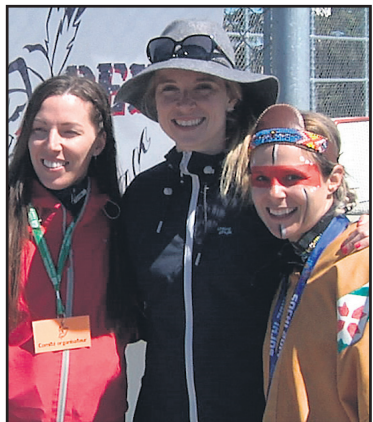
Dominique Maltais, double médaillée Olympique en snowboard cross et cinq fois détentrice du Globe de cristal, était l'invitée d'honneur de cette troisième édition.

Depuis deux années, le Défi Kapatakan est une réussite et cette édition, qui s'est déroulée sous le soleil, ne fait pas exception à la règle. En plus, les participants l'ont vécu en compagnie de l'invitée d'honneur,