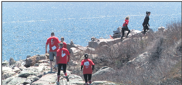
Les circuits amènent les participants sur des sites plus difficiles, question de rehausser le niveau de difficulté.