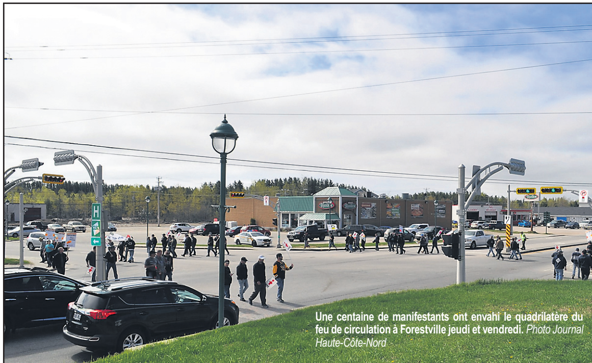
Une centaine de manifestants ont envahi le quadrilatère du feu de circulation à Forestville jeudi et vendredi.

Rappelons que les revendications portent principalement sur l'horaire