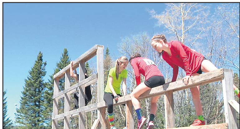
De nouveaux obstacles ont été créés par le comité organisateur.

leur territoire, l'équipe des Loisirs d'Essipit ainsi que le Conseil de Bande des Innus d'Essipit qui supporte cette activité. Rappelons que tous les profits sont remis à trois organismes de la région, soit les Chevaliers de Colomb, l'École primaire Marie-Immaculée et l'Association du hockey mineur des Escoumins.