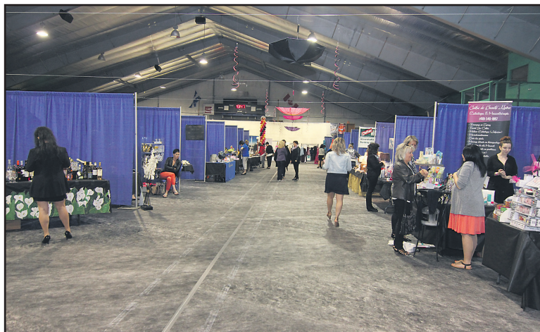
Plus de 30 kiosques, une offre diversifiée et de grande qualité pour les femmes d'ici.