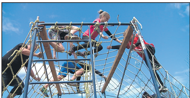
Ce sont 80 bénévoles qui travaillent sur cet événement sportif familial devenu un incontournable en Haute-Côte-Nord.