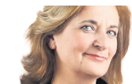
NATHALIE PETROWSKI CRITIQUE

Si j'étais critique de théâtre, j'aurais très bien pu signer le texte qu'écrivait mon collègue Luc Boulanger au sujet de Pique de Robert Lepage. Les reproches qu'il exprime sont tous légitimes. Mais il les fait d'un point de vue et d'une perspective théâtrales. Or Pique n'est pas du théâtre. Pique ne respecte aucune règle de la dramaturgie et refuse même de se laisser structurer par un texte.