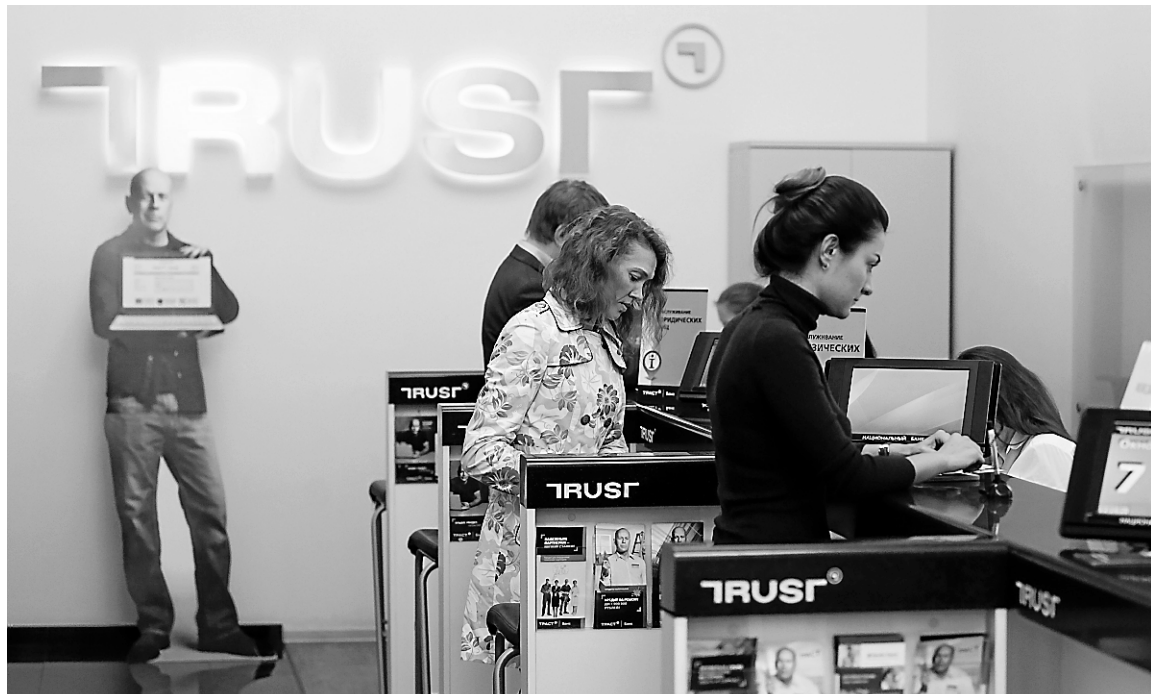
Des clients font des transactions au comptoir d'une succursale de la banque russe Trust, à Moscou. À l'arrière, une affiche publicitaire mettant en vedette l'acteur américain Bruce Willis.

Dès la semaine dernière, les autorités ont annoncé des mesures de soutien pour assurer la stabilité financière, dont une recapitalisation du secteur à hauteur de 1000 milliards de roubles (presque 23 milliards CAN).