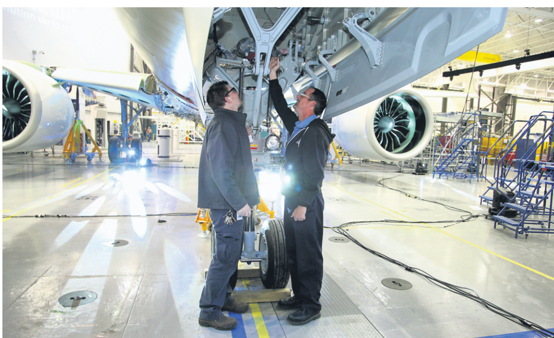
Les perspectives d'Emploi-Québec sont favorables ou acceptables pour près de 90 % des professions, et les employeurs commencent à avoir plus de difficulté à faire du recrutement.

Les travailleurs canadiens sont par ailleurs de plus en plus nombreux à changer de province pour leur travail. C'est ce qu'a remarqué le site d'emplois Workopolis en analysant sa base de données comptant plus de 7 millions de CV de travailleurs. Les déménagements interprovinciaux ont augmenté de 21 % en 10 ans.