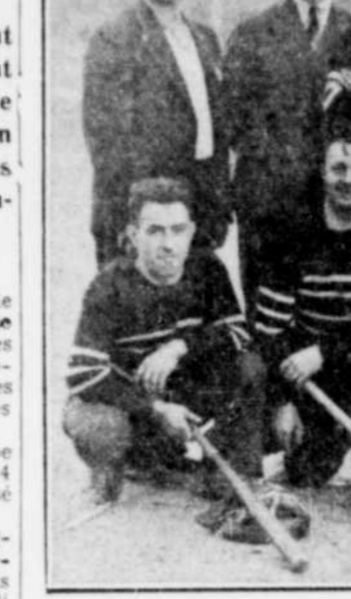
Ci-dessus l'équipe de balle-molle "Alphonse Lavallée" de Magog qui a gagné le championnat de Magog et a défait presque toutes les équipes centre qui elle a joué au cours de la saison.