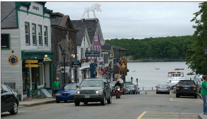
Jour 2, Bar Harbor, ME