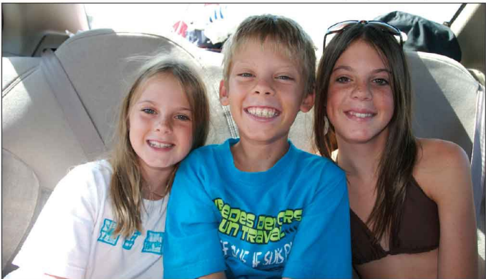
Jour 40, Le retour