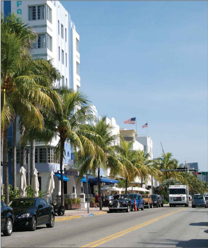
Jour 34, South Beach, FL