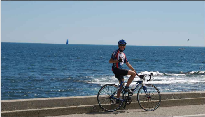
Jour 15, Sur Ocean Dr. à Newport, RI