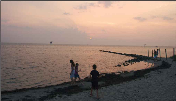
Jour 25, Ocracoke, SC