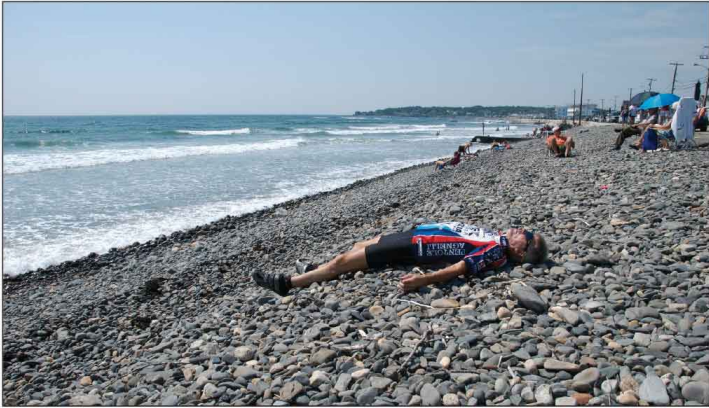
Jour 7, York Beach, ME