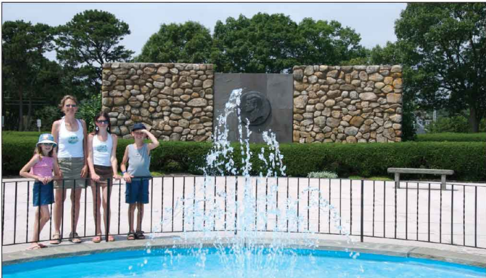
Jour 13, John F. Kennedy Memorial à Hyannis, MA