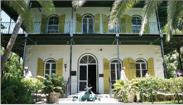
Jour 38, Hemingway Home à Key West, FL