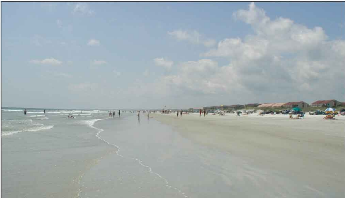
Jour 24, St. Augustine Beach, FL