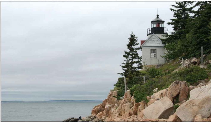
Jour 2, Bass Harbor Head Lighthouse, ME