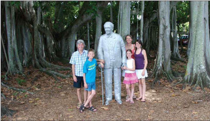
Jour 11, Edison & Ford Winter Estates, Fort Myers, FL