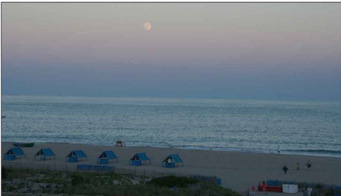
Jour 20, Clair de lune à Cape May, NJ