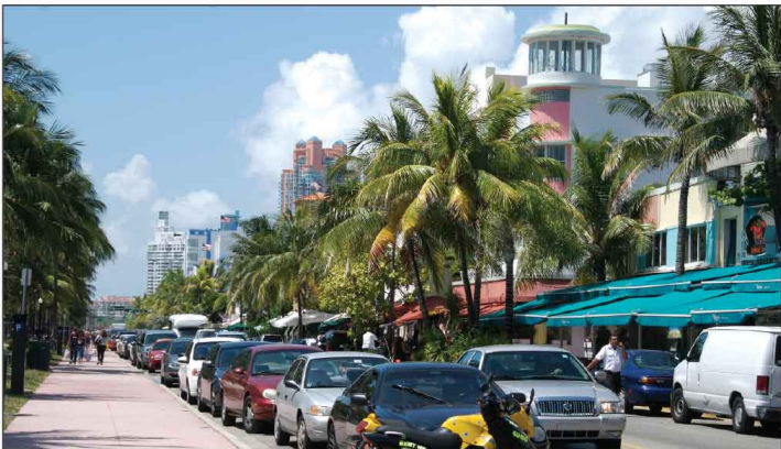
Jour 35, South Beach, FL