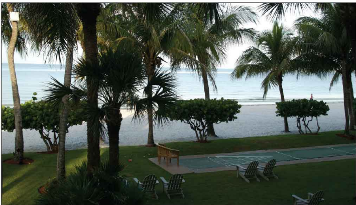
Jour 12, Fort Myers Beach - Le Best Western, FL