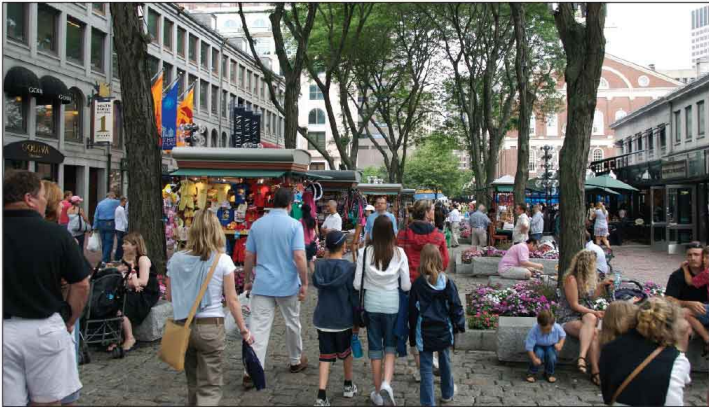
Jour 9, Faneuil Hall Market Place à Boston, MA