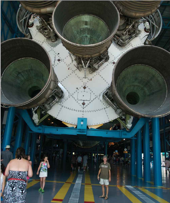
Jour 32, Fusée Saturn V d'Apollo, FL