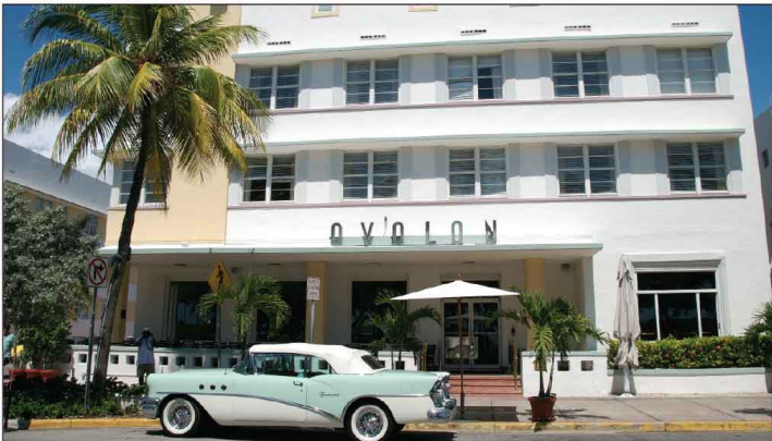
Jour 34, South Beach, FL