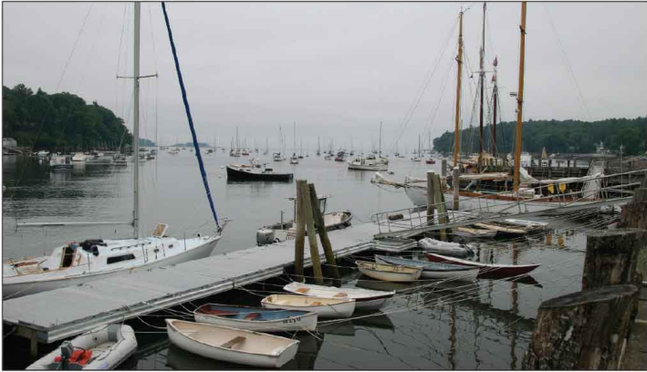
Jour 3, Port de Rockport, ME