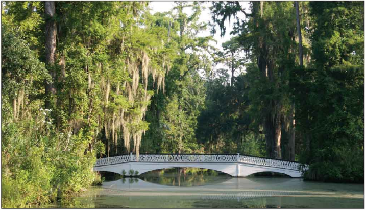
Jour 29, Magnolia Plantation, GA