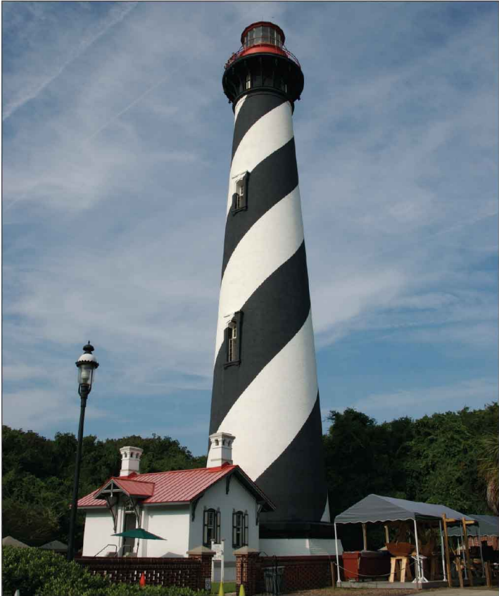
Jour 31, St. Augustine Lighthouse, FL