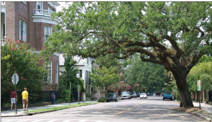
Jour 28, Charleston, SC