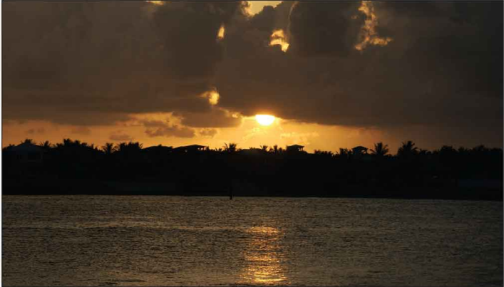
Jour 38, Mallory Square à Key West, FL