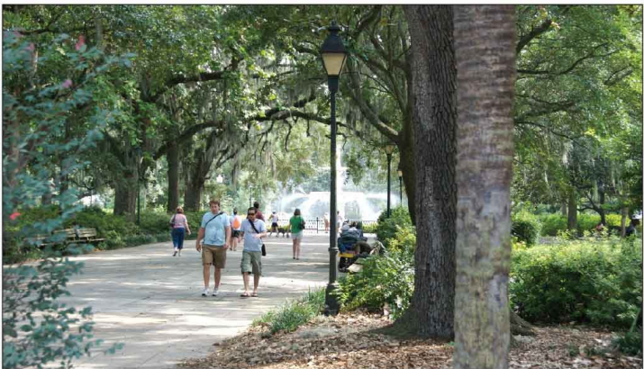
Jour 29, Savannah, GA