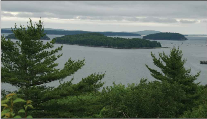
Jour 2, Acadia National Park, ME