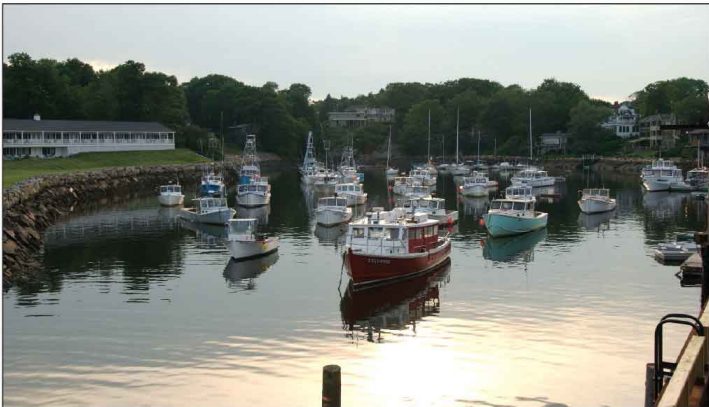
Jour 6, Ogunquit, Perkins Cove, ME