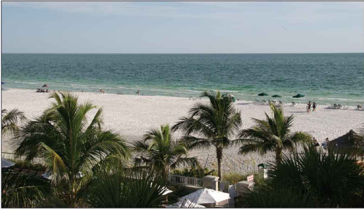
Jour 15, Lido Key, FL