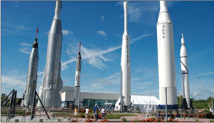
Jour 32, Kennedy Space Center, FL