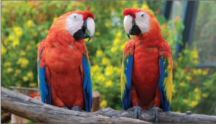
Jour 22, Butterfly World à Coconut Creek, FL