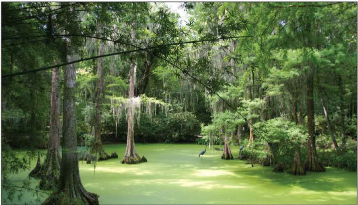
Jour 29, Magnolia Plantation, GA