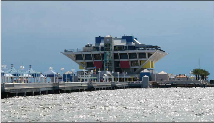
Jour 18, Pier of St.Petersburg, FL