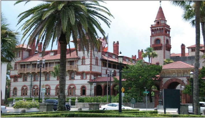
Jour 30, Flagler College, St. Augustine, FL