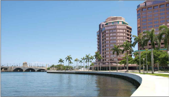
Jour 33, West Palm Beach, FL