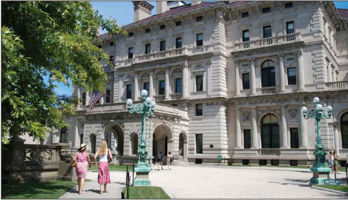
Jour 14, Manoir The Breakers à Newport, RI