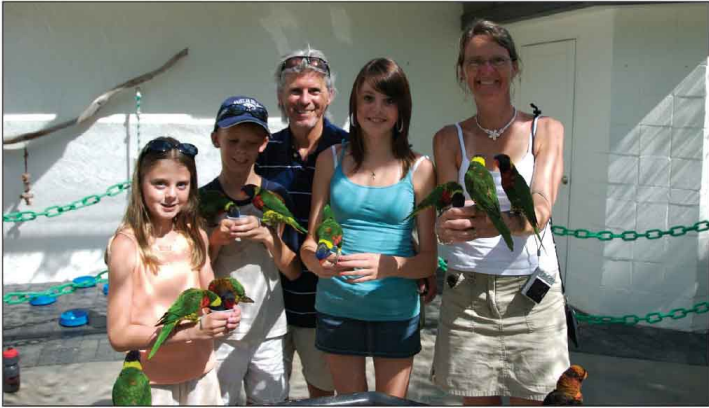
Jour 22, Butterfly World à Coconut Creek, FL