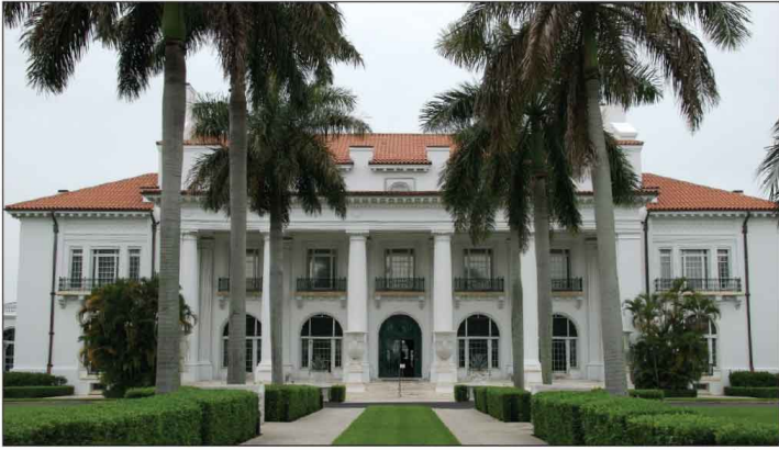
Jour 8, Flagler Museum à Palm Beach, FL