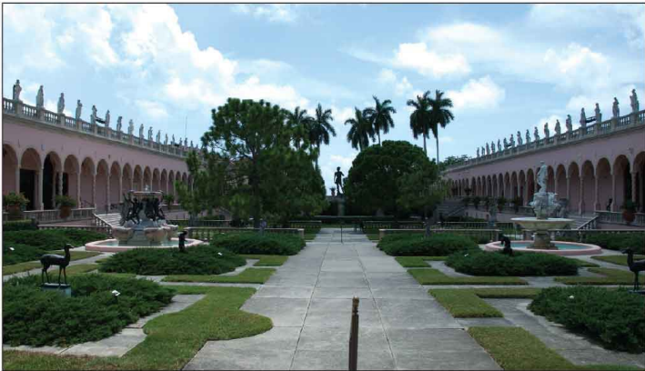
Jour 16, Ringling Museum of Art à Sarasota, FL