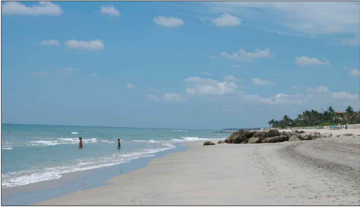
Jour 33, Palm Beach, FL