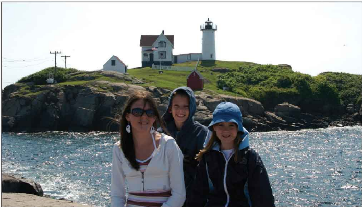
Jour 7, Cape Neddick "Nubble" Light, ME