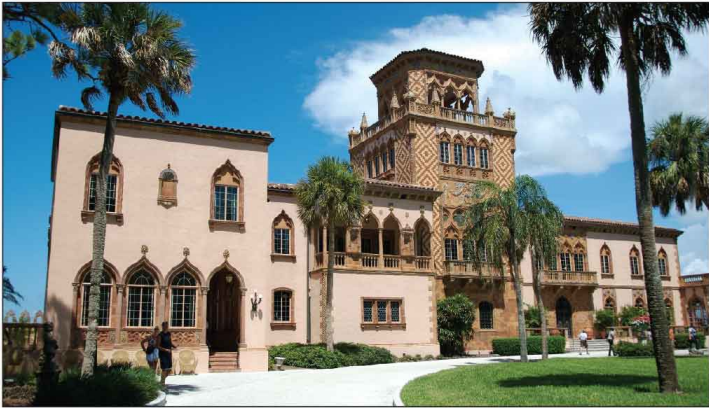
Jour 16, Cà d'Zan Mansion à Sarasota, FL