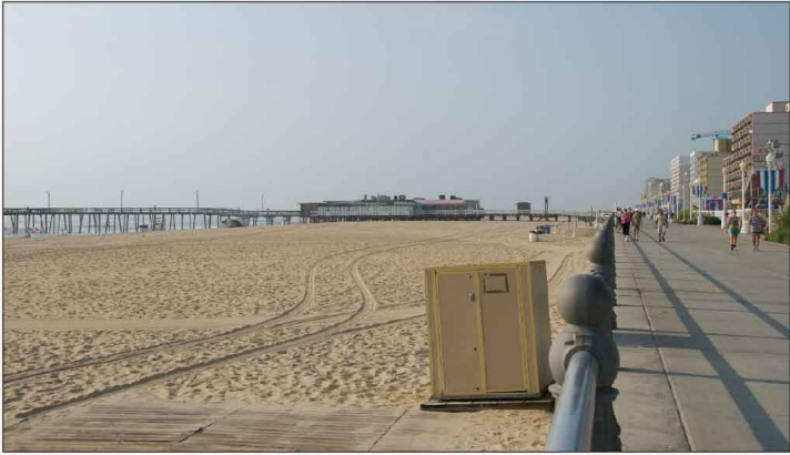
Jour 24, Virginia Beach, VA