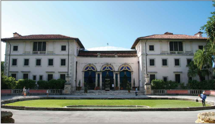
Jour 36, Villa Vizcaya, FL