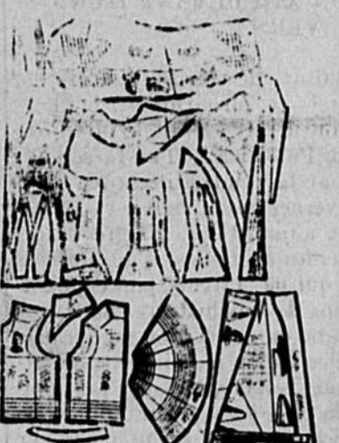
(Cette vignette représente le système de coupe complet.)