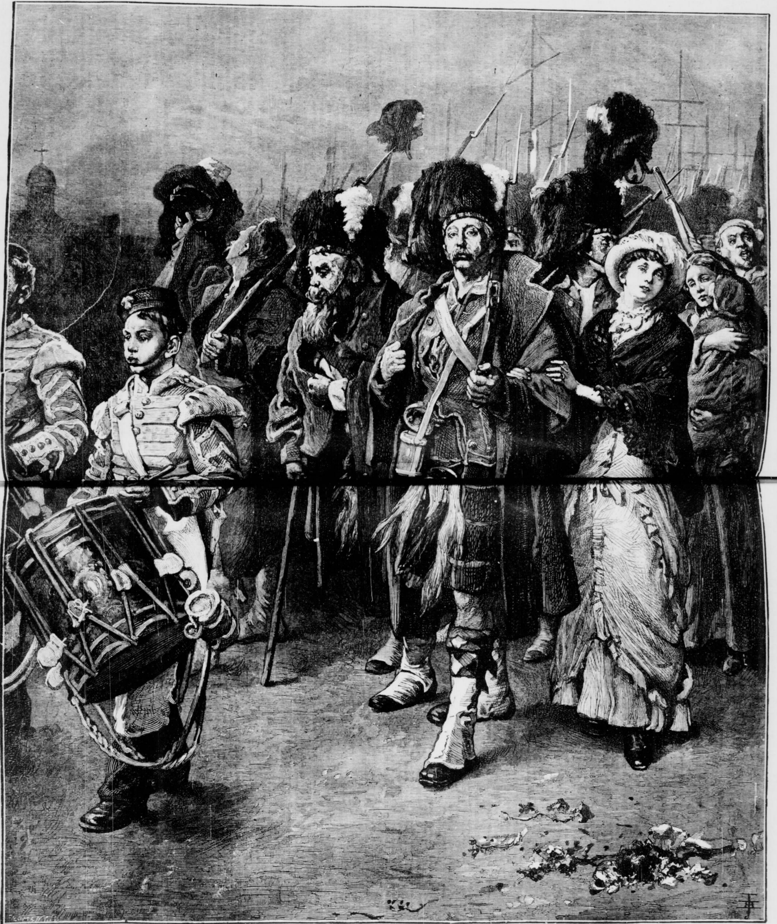
APRÈS LA GUERRE