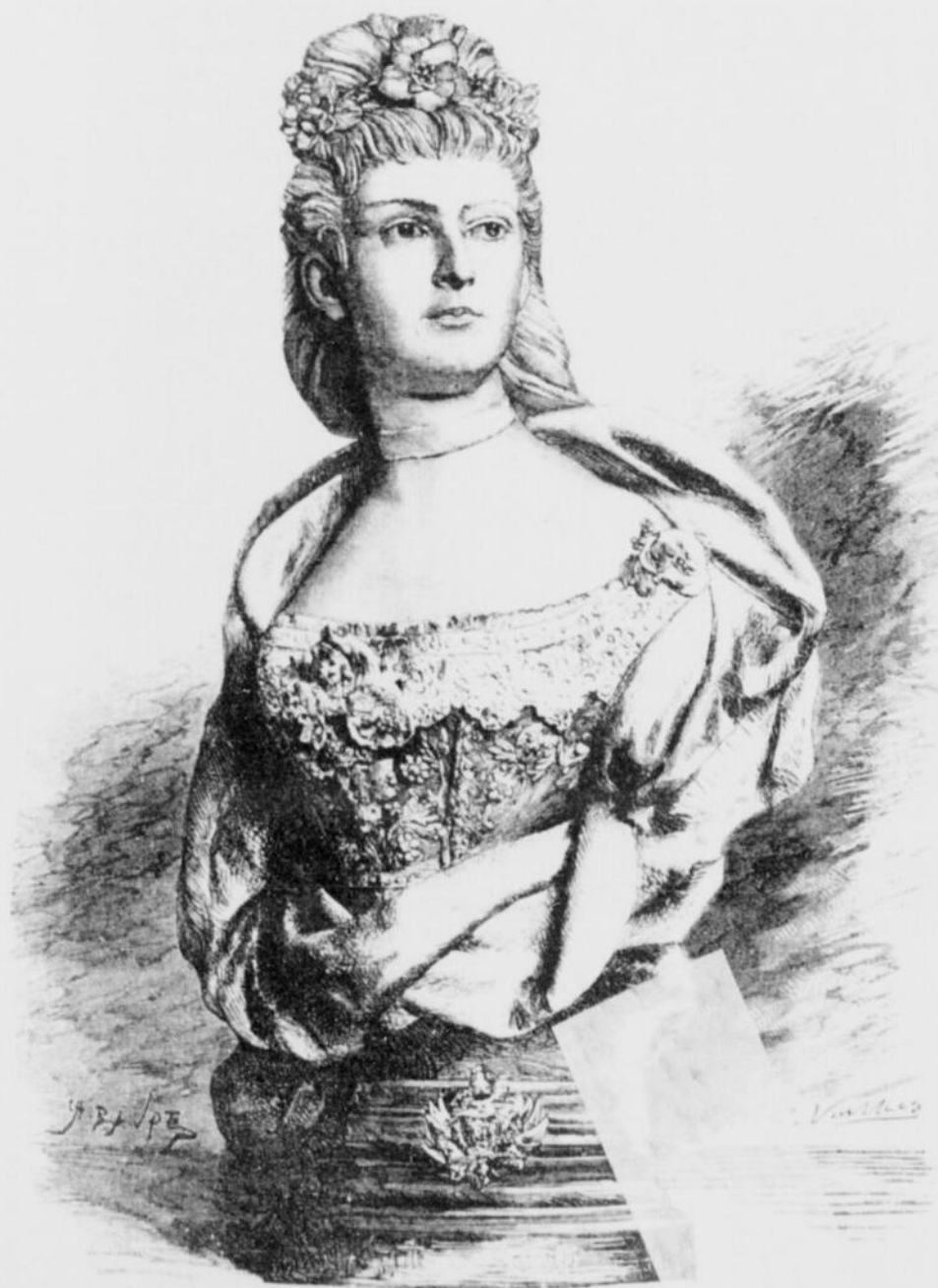
LE BUSTE DE L'IMPÉRATRICE ÉLISABETH D'AUTRICHE-HONGRIE