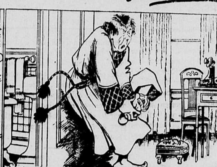
et comme tu es seul à la maison et que tu attends un appel important tu te précipites, glisses sur le savon, t'accroches dans la robe de chambre, te trappes le gros orteil. —