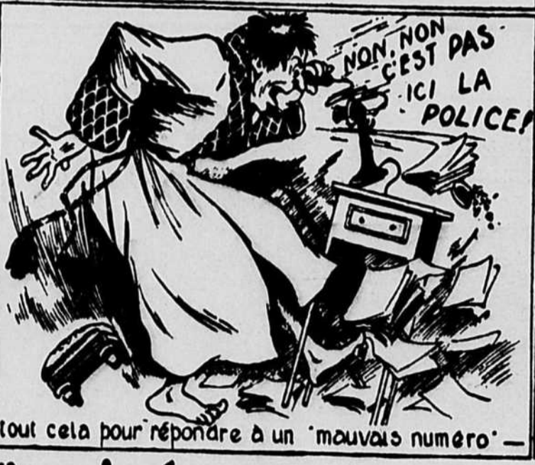
tout cela pour répondre à un 'mauvais numéro' —