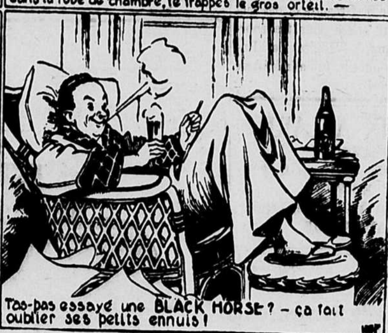
Tas pas essayé une BLACK HORSE ? — ça fait oublier ses petits ennuis !

dites simplement — "Bière Black Horse Dawes s.v.p.!"