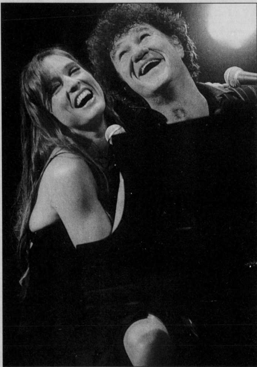
Avec Lynda Lemay, rare véritable rencontre du spectacle.

notre dernier concert à vie». Ce discours n'est pas assez répandu chez les artistes et force est d'admettre que ça vit intensément sous la bannière Dionysos. Et c'est pour ça que les concerts d'aujourd'hui, à l'extérieur (au Parc des Festivals, à 22h), et de demain (au Spectrum avec Galaxie 500, à 23h) sont à ne pas manquer.