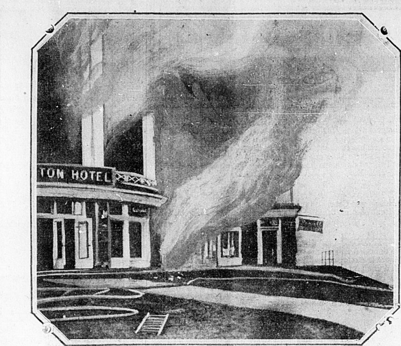
Les flammes détruisant le fameux hôtel de Niagara le "Clifton House".