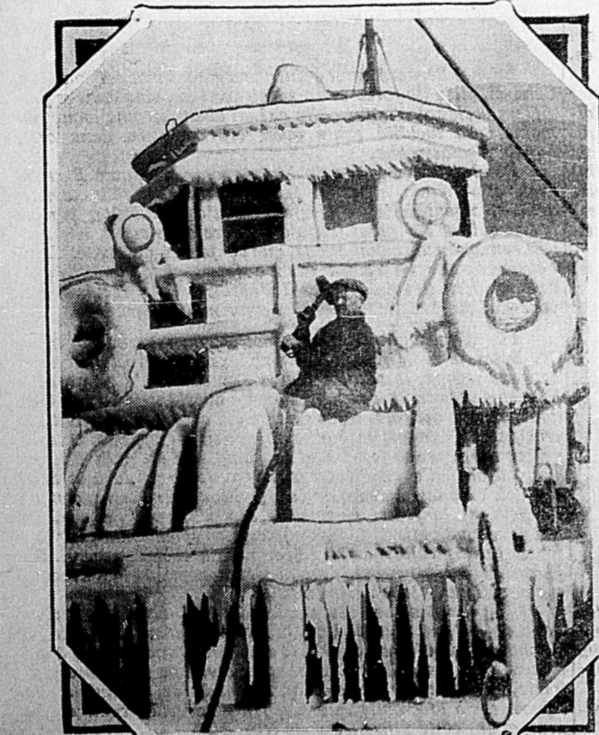
Le "Holy Cross" rentre au port de Boston après un voyage dans les pêcheries. La glace a complètement recouvert le cha-lutier.

Familles catholiques: 3299, familles non-catholiques: 194, familles mixtes: 5. Total des familles: 3498. - Communiant: 14,685. - Non-Communiant: 4,336. Population catholique: 18,991. Population non-catholique: 805. Population totale: 19,796.