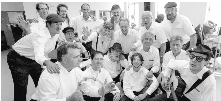
La chorale de l'accueil Bonneau, en 1998.

À COMPTER de demain, la cour municipale de Montréal comptera huit points de service au lieu des 22 en place depuis l'entrée en fonction de la nouvelle Ville. Le « chef-lieu » se trouve à côté de l'hôtel de ville, tandis que les sept autres points de service sont dans les arrondissements de Pointe-Claire, Saint-Laurent, Verdun, Saint-Léonard, Côte-Saint-Luc/Hampstead/Montréal-Ouest, Rivières-des-Prairies/Pointe-aux-Trembles/Montréal-Est et Outremont. Les cours municipales de plusieurs arrondissements ont fermé en raison du faible volume de dossiers qu'elles traitaient. Par ailleurs, le paiement des contraventions se fera toujours dans les institutions financières ou dans les 40 comptoirs répartis dans les bureaux d'arrondissements et les bureaux d'Accès-Montréal. Autre nouveauté, les procès en matière d'infraction au stationnement sans témoin se feront sur rendez-vous, à la date et l'heure où le citoyen est disponible.