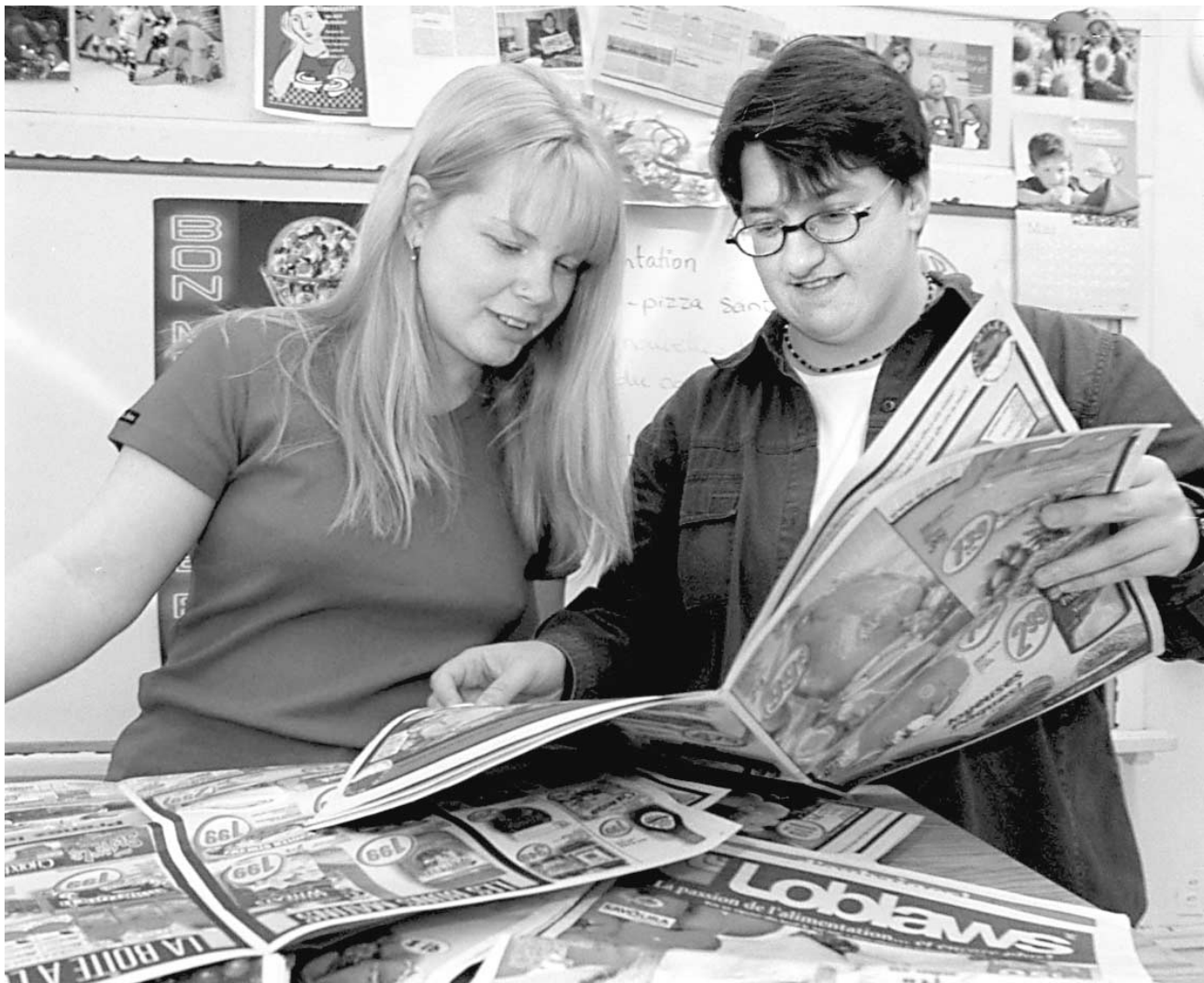
Une tradition dominicale en péril.